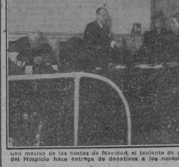
Con motivo de las fiestas de Navidad, el teniente de alcalde del distrito del Hospicio hace entrega de donativos a los necesitados del distrito.