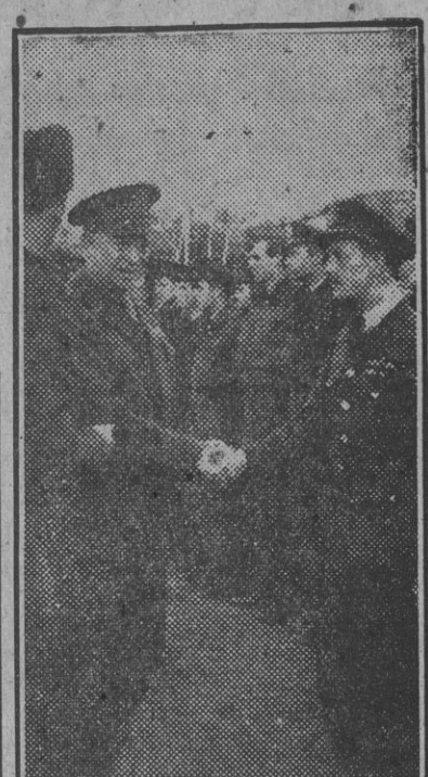
El general Eisenhower revista los pilotos de la R. A. F. que, concentrados en una localidad, se disponen a partir para los aeródromos...