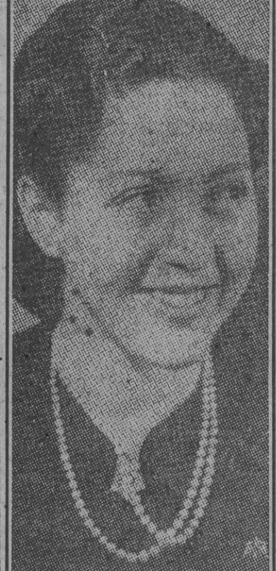
La Reina Alejandra de Yugoslavia, que espera un hijo para la próxima primavera...