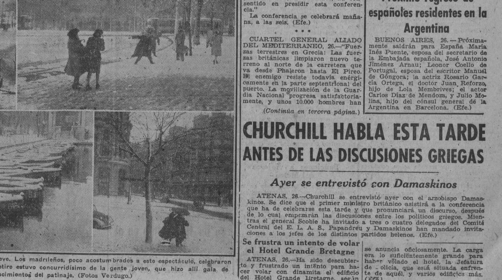
Madrid apareció ayer, cubierto de nieve. Los madrileños, poco acostumbrados a este espectáculo, celebraron con regocijo el acontecimiento, y el Retiro estuvo concurridísimo de la gente joven, que hizo allí gala de sus conocimientos del patinaje.