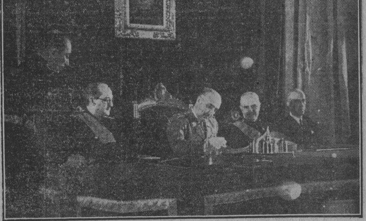
El Caudillo durante la solemne clausura de la quinta reunión del Consejo de Investigaciones Científicas, acto al que asistieron los ministros de Educación Nacional, Obras Públicas y Aire.