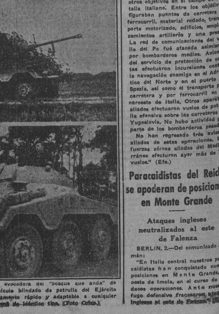
La fotografía superior—tan evocadora del "botique que anda" de "Maobeth"—presenta un vehículo blindado de patrulla del Ejército alemán, dotado de un armamento rápido y adaptable a cualquier terreno. Abajo, una granada de 140 kilos tipo "Dora"