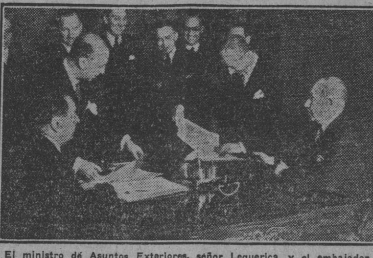
El ministro de Asuntos Exteriores, señor Lequerica, y el embajador de Estados Unidos en Madrid, señor Hayes, en la firma del Convenio relativo al funcionamiento de servicios internacionales de transporte aéreo.

A la una de la tarde hoy ha tenido efecto, en el Palacio de Santa Cruz, el canje de notas entre el ministro de Asuntos Exteriores, señor Lequerica, y el embajador de los Estados Unidos, señor Hayes, contenido los términos del "Convenio relativo al funcionamiento de servicios internacionales de transporte aéreo", con asistencia de altos funcionarios de la Embajada de los Estados Unidos en Madrid y personal diplomático del Ministerio de Asuntos Exteriores.