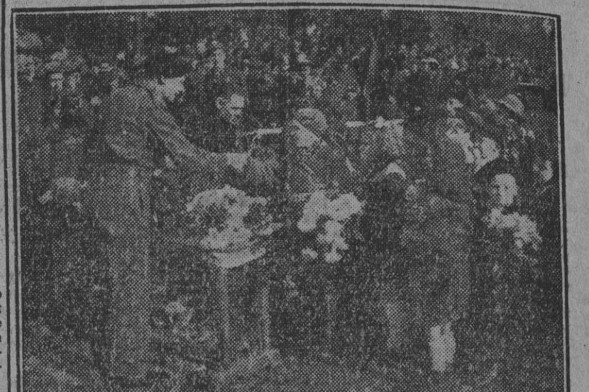
Una joven belga entrega a Montgomery unos ramos de flores momentos después de celebrarse una ceremonia militar en una aldea belga, donde el mariscal decoró a varios soldados canadienses.