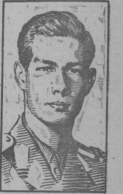
EL REY MIGUEL DE RUMANIA

La última parte de la proclama no pudo oírse con claridad; pero, según declara la Oficina de Información de Guerra de Nueva York, el dictador dijo: "El futuro de Rumania depende del futuro de Europa. Los rumanos defiendan sus derechos, ¡defendamos Rumania!" Después de estas palabras, la radio de Bucarest emitió el himno nacional. (Efe.)