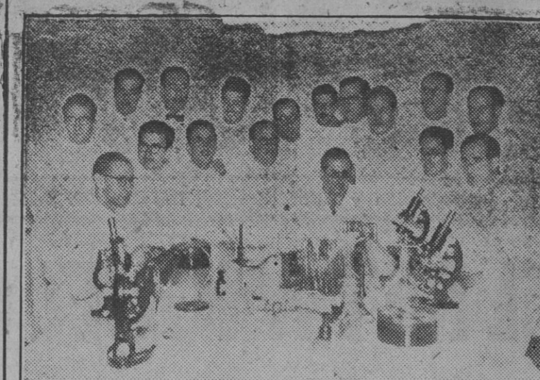
Grupo de médicos que asisten a dicho curso para ingreso en el Cuerpo Médico de Doctores y la Guinea Española...