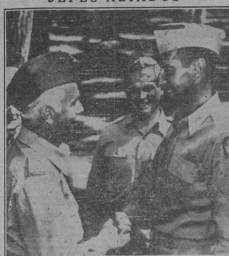
El general Clark saluda al general Sosnkowski, jefe de las fuerzas polacas que combaten con el quinto ejército aliado en Italia.