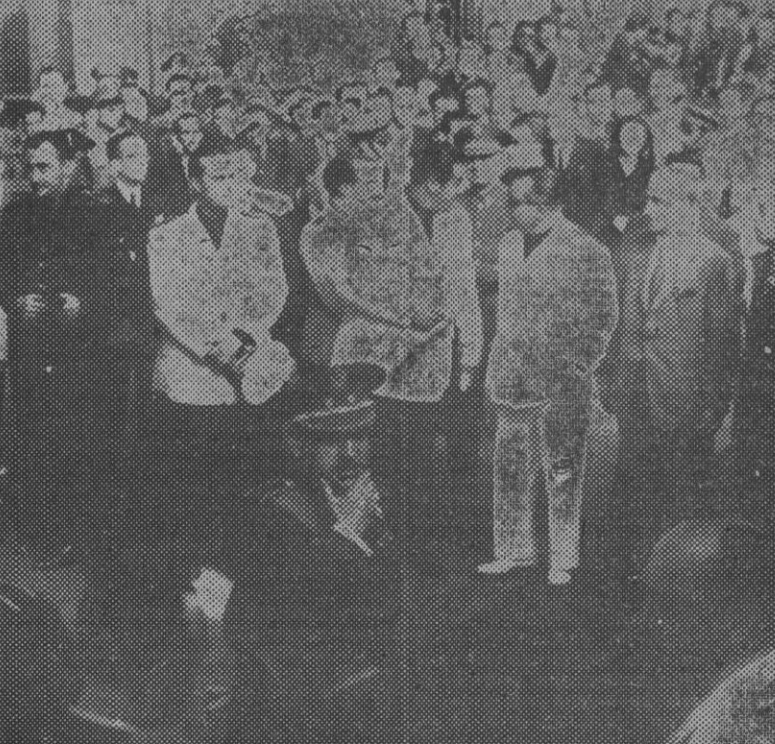
El Gobierno en pleno preside el acto de traslado de los restos del conde de Jordana a la capilla ardiente instalada en el Ministerio de Asuntos Exteriores.

Señala el inapropiado acceso ferroviario, ya que el actual resuelve el problema de la ciudad por el momento, pero previendo un plan de destrucción y de extensión necesaria el citado acceso ferroviario dificultaría tal proyecto por separar una serie de zonas residenciales y crear abundantes industrias que se desarrollan en el lugar más conveniente para la extensión de Tetuán. Cita también el inadecuado emplazamiento de los cuarteles, que, quedando dentro del núcleo principal, ocupan extensiones de gran interés para la mejor ordenación y reforma interior y a su vez que son insuficientes para las necesidades de estos cuarteles. Menciona la gran escasez de espacios libres, sobre todo en la zona interior, donde se acumulan, faltando zonas necesarias para el esparcimiento infantil; la mezcla de las diferentes edificaciones, la ausencia total de un criterio arquitectónico, el desorden total en su extensión, desarrollándose núcleos de viviendas sin sujeción a plan alguno; la existencia de barrios de las latas, la carencia de un plan de emplazamiento de edificios públicos y la in-