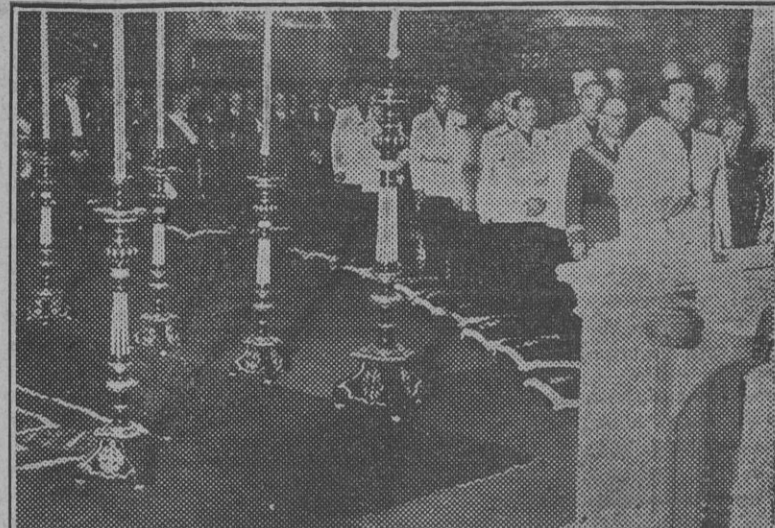
El Gobierno en la presidencia de los funerales celebrados esta mañana en San Francisco el Grande por el eterno descanso del conde de Jordana.

El jefe del Protocolo visita al embajador de España. SANTIAGO DE CHILE, 5.—El jefe del Protocolo ha visitado al embajador de España para transmitirle oficialmente el pésame del Gobierno chileno con motivo de la muerte del conde de Jordana. El primer ministro de Chile, don Pedro Pablo Kuczynski, también expresó sus pésames al conde de Jordana, "preclaro servidor de su Patria y que naturalmente figuró entre los verdaderos españoles—dice—durante la guerra civil española." (Efe.) SANTIAGO DE CHILE, 5.—El jefe de Protocolo ha visitado al embajador de España para transmitirle oficialmente el pésame del Gobierno chileno con motivo de la muerte del conde de Jordana. (Efe.)