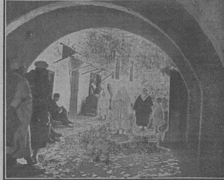
Aspecto de una vieja aunque típica calle de la ciudad de Tetuán, en Marruecos español.

Importante ordenanza del teniente general Orgaz sobre las necesidades de la ciudad marroquí