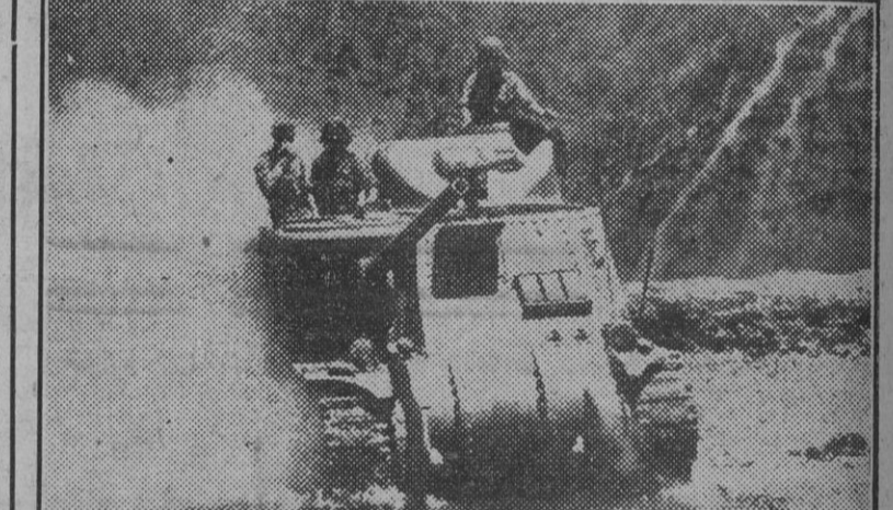
En el sector de Kohima un tanque inglés cruza un río persiguiendo a japoneses que se retiran.