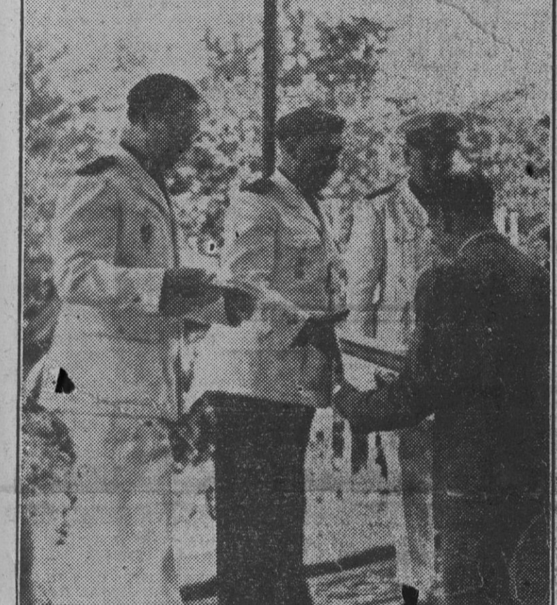
Su Excelencia el Jefe del Estado hace entrega a los jefes de diversas Empresas de los diplomas que las acreditan como modelo de organización económica-social. No es un galardón trivial, sino premio del más alto valor al esfuerzo desarrollado por estas Empresas para cumplir las consignas de avance social dictadas por el nuevo Estado, Acompaña al Caudillo el ministro secretario general del Movimiento y el Delegado Nacional de Sindicatos.

2.096 viviendas protegidas han sido entregadas hoy en toda España