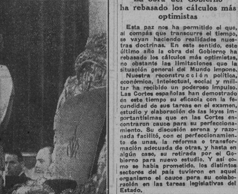
Su Excelencia el Jefe del Estado en un momento trascendental de su discurso pronunciado ayer ante el Consejo Nacional de F. E. T. y de las J. O. N.-S.

La obra del Gobierno ha rebasado los cálculos más optimistas Esta paz nos ha permitido el que, al compás que transcurrió el tiempo, se vayan haciendo realidades nuestras doctrinas. En este sentido, este último año la obra del Gobierno ha rebasado los cálculos más optimistas, no obstante las limitaciones que la situación general del mundo impone. Nuestra reconstrucción política, económica, intelectual, social y militar ha recibido un poderoso impulso. Las Cortes españolas han demostrado en este tiempo su eficacia con la fecundidad de sus tareas en el examen, estudio y elaboración de las leyes importantes que en las Cortes españolas se han producido para su perfeccionamiento. Su discusión serena y razonada, con el perfeccionamiento de unas la reforma o transformación adecuada de otras, y hasta en algún caso, su retirada por el Gobierno para nuevo estudio. Y así como se había prometido, los distintos departamentos ministeriales le organizaron el cauce para su colaboración en las tareas legislativas del Estado.