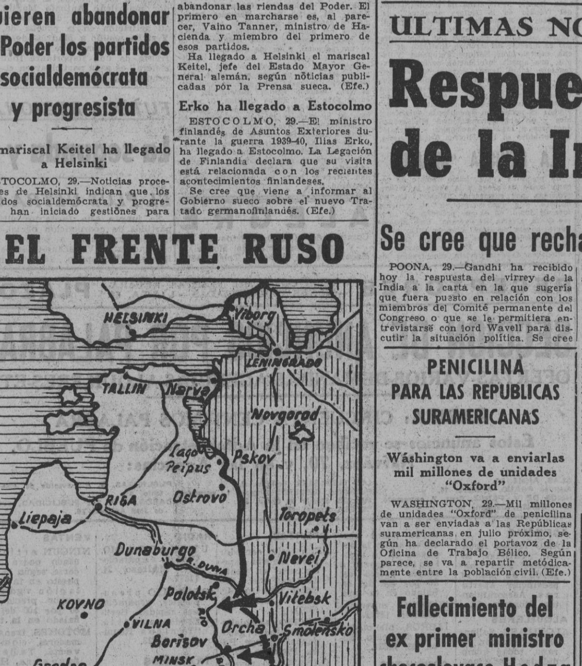
Las flechas del gráfico indican las tres principales direcciones que persiguen las tropas rusas en la actualidad. La lucha se desarrolla con gran presión de las fuerzas soviéticas, que tropiezan con una encarnizada resistencia alemana.