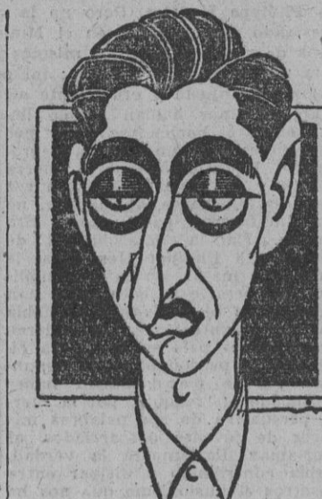
Julión Berrendero, vencedor esta mañana en la Vuelta a los Puertos batiendo el record de la prueba.