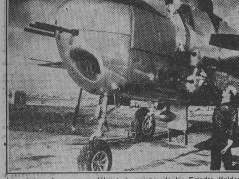
Los obreros de una gran fábrica de aviones de los Estados Unidos comprueban las ametralladoras montadas debajo del puesto del piloto en el nuevo modelo de E-25 Mitchell...