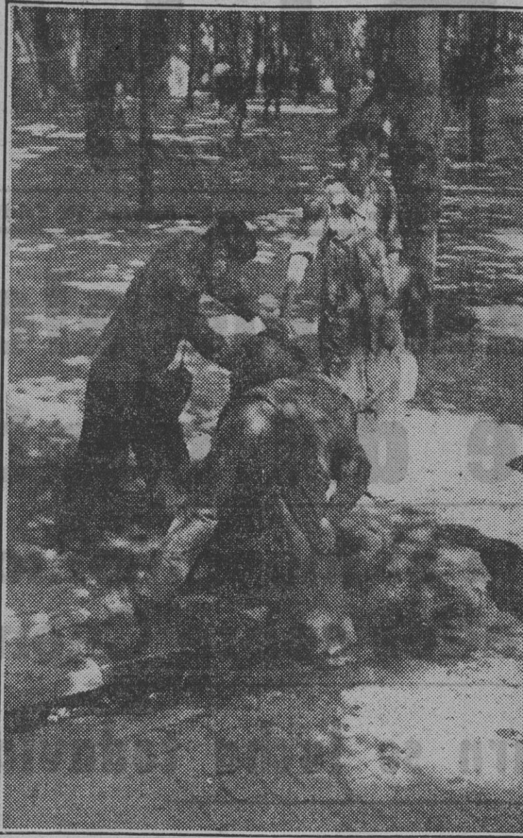
El tranvía está anclado fuera del campo fotográfico. Naturalmente tampoco se ve el grabado a los viajeros. Lo único que pueden ustedes contemplar es al piloto y al administrativo del coche que...