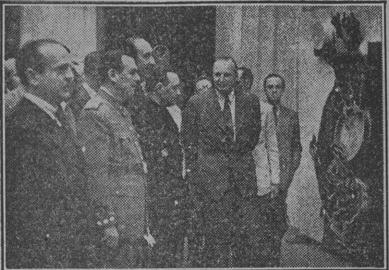
El vicesecretario general del Movimiento y otras personalidades y jerarquías durante su visita a la Exposición de Fisiología, Anatomía e Higiene.

Presidieron la inauguración el vicesecretario general del Movimiento y el doctor Petrarca, en representación de los ministros secretario general y de la Gobernación