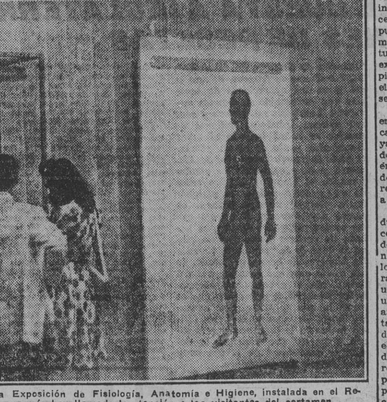
El "hombre de cristal", que figura en la Exposición de Fisiología, Anatomía e Higiene, instalada en el Retiro, y que es una de las figuras que más han llamado la atención a los visitantes del certamen.

lo que en sí significa: el deseo de divulgar la aportación de la Medicina española y la alemana a la ciencia. Los médicos españoles gozan de un sólido prestigio en el mundo; raro es el Congreso en el que nuestra representación no ocupa un puesto destacado.