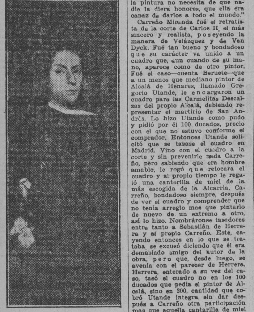
Don José Carreño de Miranda, pintor de Carlos II.