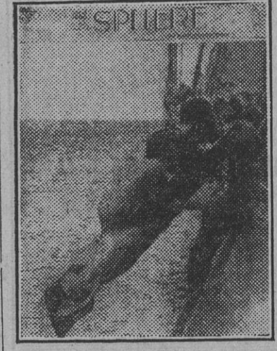
"Sphere" publica esta interesante fotografía del torpedo humano, hasta ahora arma secreta de la Marina aliada. El torpedo es tripulado por dos personas y la popa del mismo se coloca debajo del vapor anclado y mediante un dispositivo especial se empuja al agua. El torpedo está en el momento de ser lanzado por las tripulantes, que en el caso más favorable casen prisioneros. Han sido torpedeadas ya varias unidades de gran tonelaje.