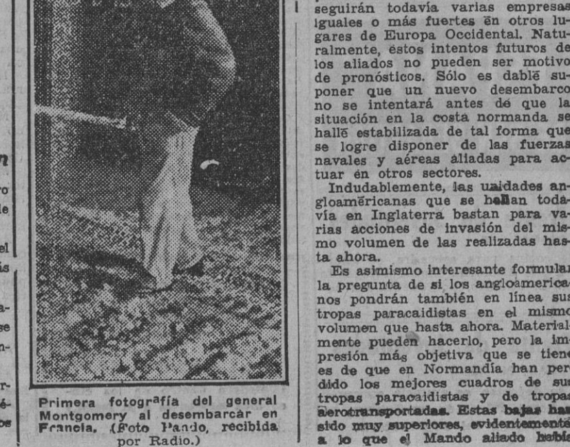
Primera fotografía del general Montgomery al desembarcar en Francia.