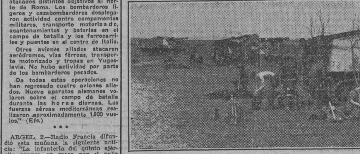
Carros “Avispones” alemanes descansando en una pausa del combate en el sector meridional del frente oriental.