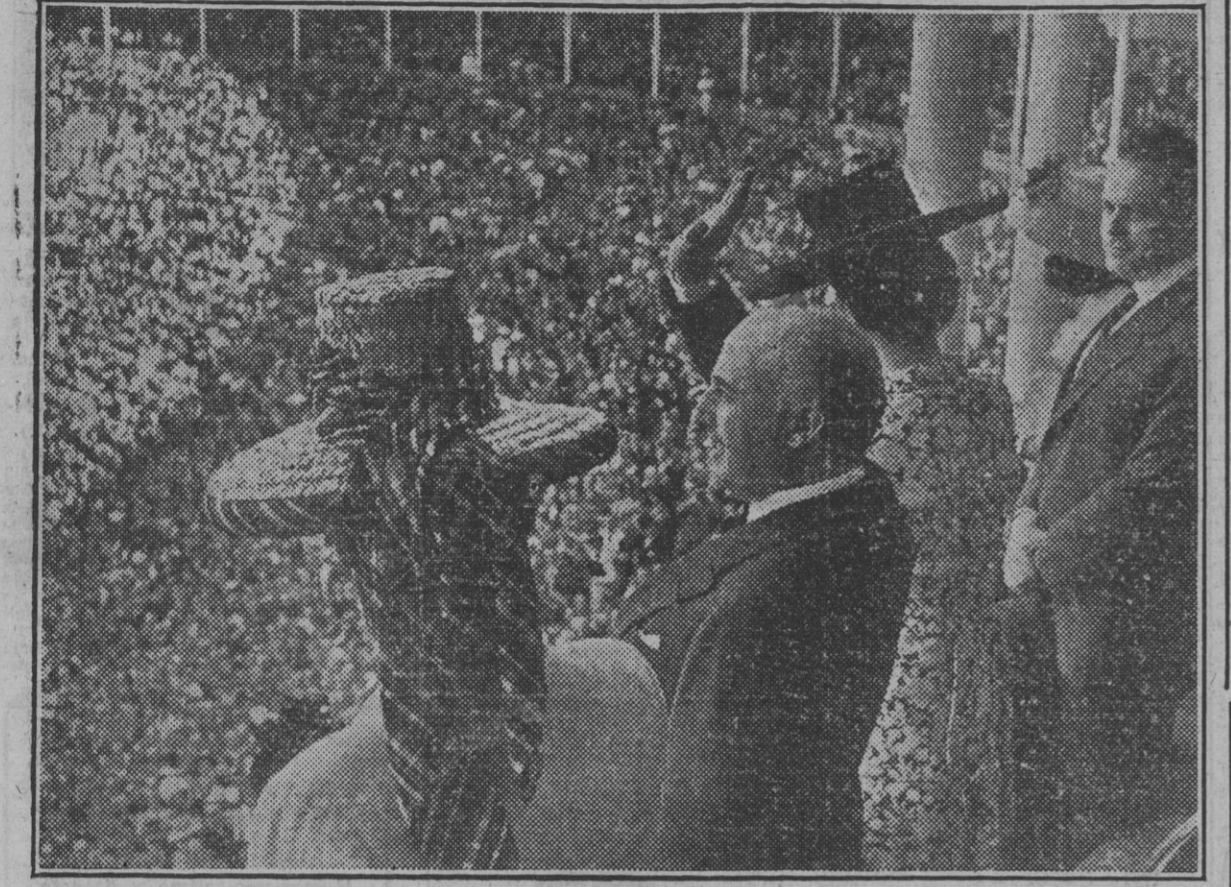
El jefe del Estado corresponde brazo en alto a las aclamaciones que rindió a Su Excelencia el público que llenaba la Plaza de Toros, en la corrida organizada por la Diputación Provincial a beneficio del Hospital.