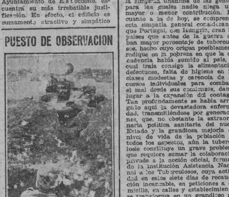
Un soldado alemán de observación en el frente del Báltico. Mueve un telescopio de la línea de defensa se halla un tanque soviético destruido.