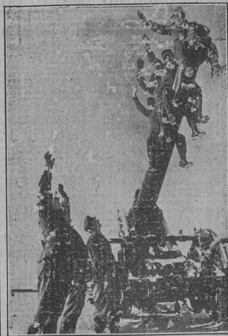
Más alto ya no puede ser. A esta pequeña diversión después de la maniobra se entregan los artilleros alemanes de un puesto perteneciente al frente del mar Báltico.