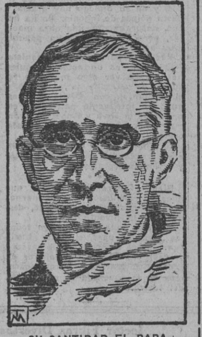
SU SANTIDAD EL PAPA

CIUDAD DEL VATICANO, 2.—Con motivo de la fiesta de la Pascua de Pentecostés, Su Santidad el Papa Pío XII ha recibido al Sacro Colegio Cardenalicio, quien, por boca de su decano, el cardenal Pignatelli di Belmonte, le transmitió sus felicitaciones.