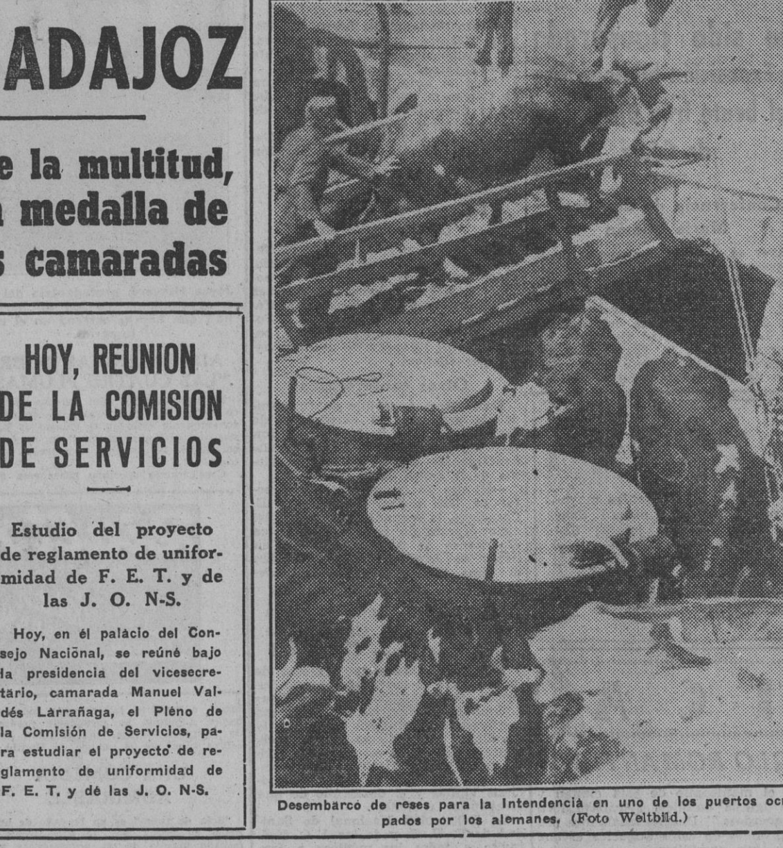
Desembarco de reses para la Intendencia en uno de los puertos ocupados por los alemanes.