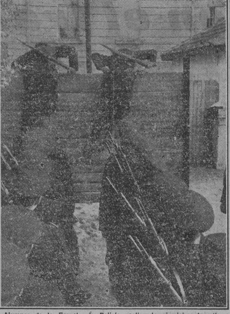
Alumnos de la Escuela de Policía realizando ejercicios deportivos militares.