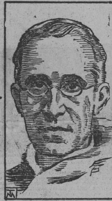
SU SANTIDAD EL PAPA