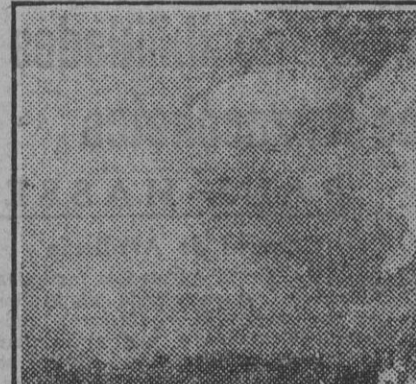
'Bateles', por Jesús Apellaniz.