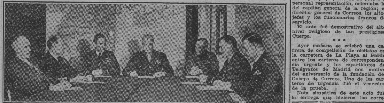
De izquierda a derecha: general Omar Bradley, jefe de las fuerzas terrestres norteamericanas; almirante sir B. Ramsay, jefe naval aliado; mariscal del Aire sir Arthur Tedder, comandante en jefe de las fuerzas aéreas aliadas; general Dwight Eisenhower, comandante en jefe de las fuerzas de invasión; general Montgomery, jefe de las fuerzas terrestres británicas; mariscal del Aire sir T. Leigh-Mallory, y el general W. Bedell-Smith, jefe de Estado Mayor.