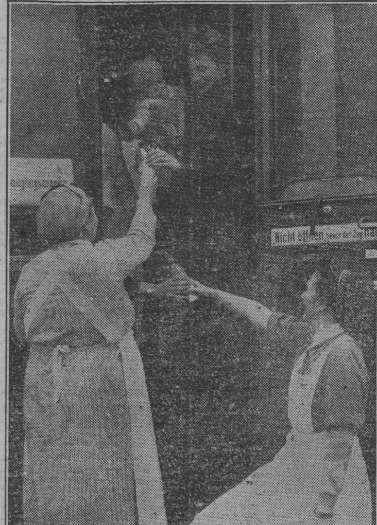
Para poner fuera de peligro a las criaturas que viven en Berlín han sido organizados numerosos trenes especiales en los que son trasladados a localidades lejanas de la capital.