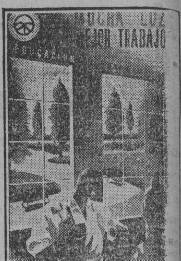
Cartel anunciador de la 'belleza para el trabajo'.