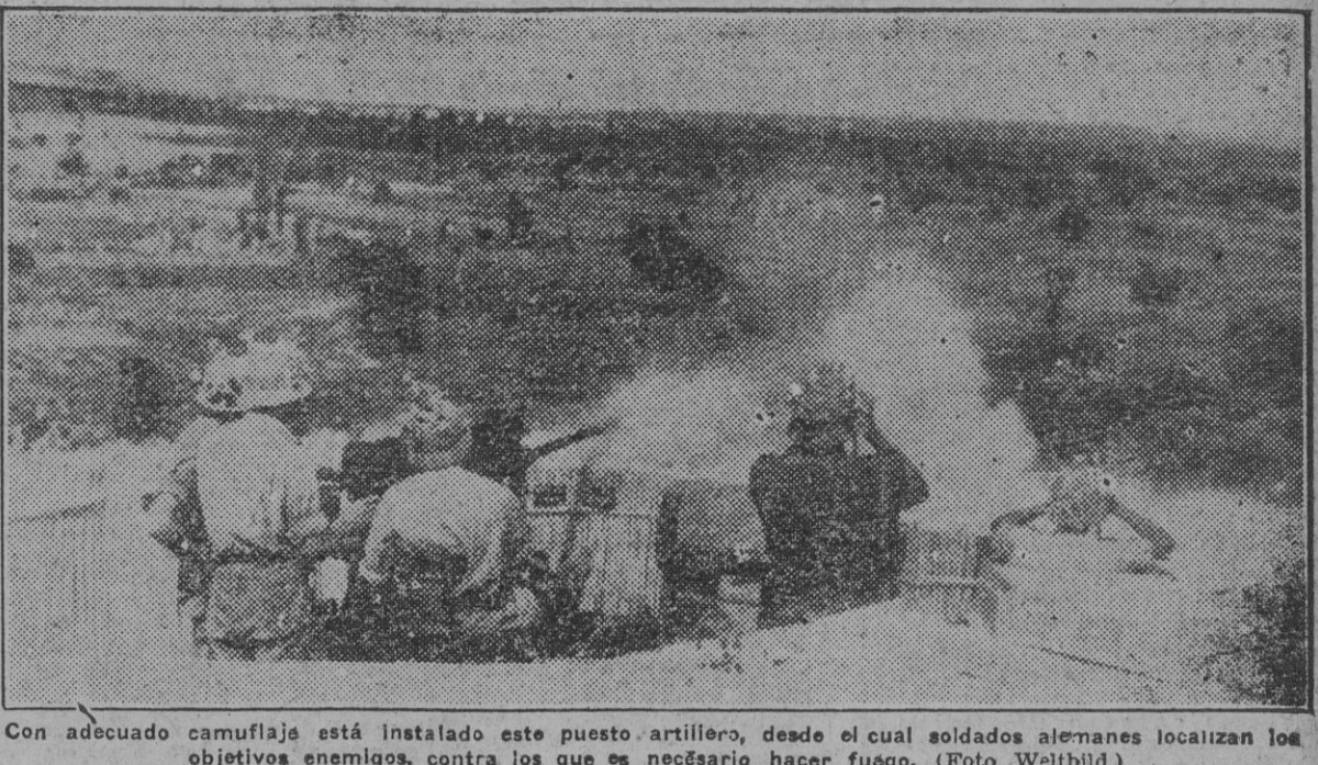
Con adecuado camuflaje está instalado este puesto artillero, desde el cual soldados alemanes localizan los objetivos enemigos, contra los que es necesario hacer fuego.