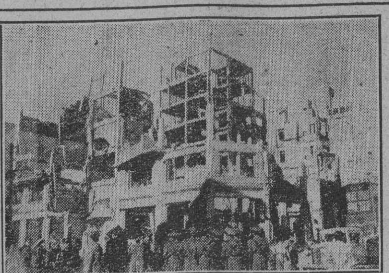
Estado en que quedó la casa derrumbada de la calle de Maldonado.

Han llegado a las Cortes nuevos proyectos de ley para su estudio, y entre ellos los que refieren a continuación, por haberse publica-