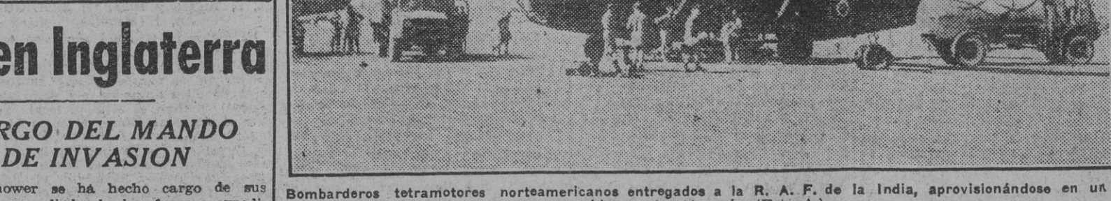
Bombarderos tetramotores norteamericanos entregados a la R. A. F. de la India, provisionándose en un aeródromo de este país.

Para la gran batalla que se avecina es indispensable que en uno y otro bando beligerantes se preparen armas desconocidas, cuyo empleo les hace concebir grandes esperanzas. Los alemanes han anunciado repetidas veces que en su hora surgirá el arma de represalia. No es ningún misterio la construcción de unos aeródromos especiales, según un diario inglés, bombardeados ya por la R. A. F. desde los que en cualquier momento pueden partir infinidad de modernas bombas cohetes concentradas al caer sobre determinada ciudad británica. Nuevos cañones antiaéreos han hecho ya su aparición, así como potentes y desconocidos explosivos. Por su parte, los aliados tienen gran fe en su aviación poderosa. Se cita como muestra de su gigante de gran radio de acción de superiores facultades a las de la fortaleza volante. Nadie es capaz de prever hasta dónde llegará la capacidad de destrucción de los ejércitos en lucha ni las calamidades que amenazan al Mundo como consecuencia de esta guerra trágica, en la que se hallan empeñados jóvenes y pujantes pueblos.