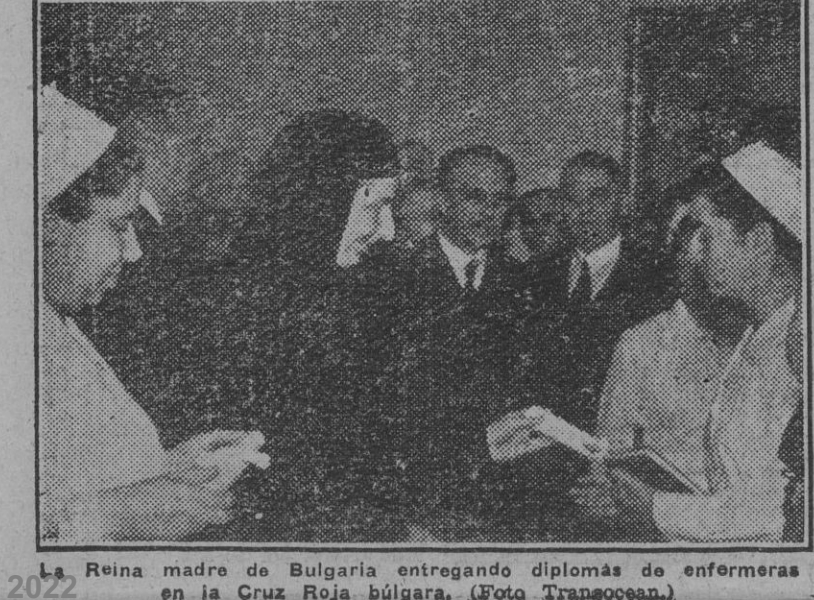
La Reina madre de Bulgaria entregando diplomas de enfermeras en la Cruz Roja búlgara.