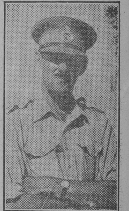
El teniente general sir Oliver Leese, nuevo jefe del octavo ejército británico.