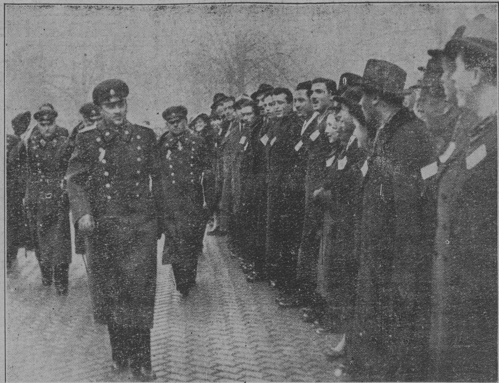
El día de San Clemente es la fiesta de los estudiantes búlgaros. En ella ha participado el príncipe Cirilo, que a su llegada fué saludado con entusiasmo por sus estudiantes.