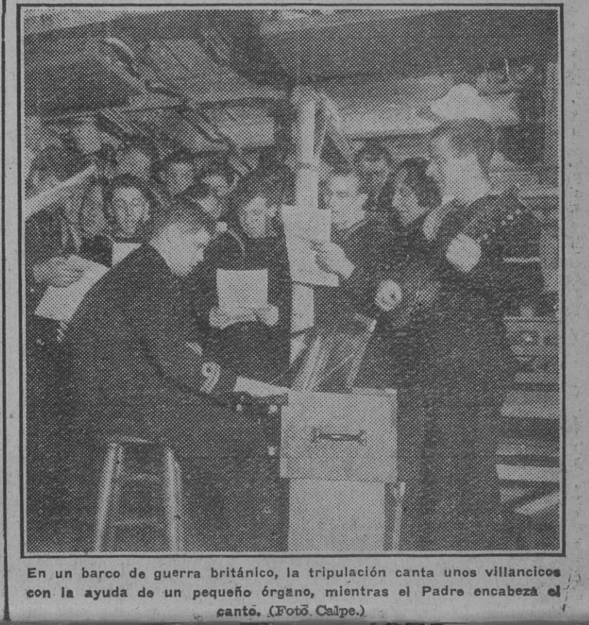
En un barco de guerra británico, la tripulación canta unos villancicos con la ayuda de un pequeño órgano, mientras el Padre encabeza el canto.