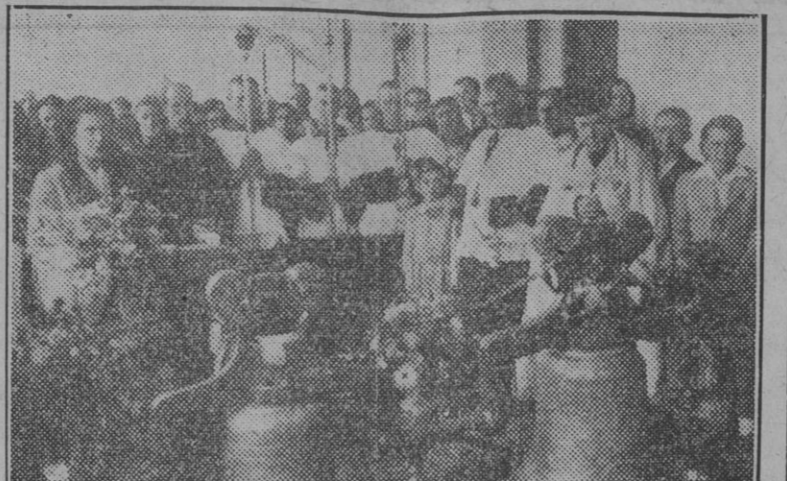
Un momento del acto de la bendición de dos campanas destinadas a la nueva iglesia que se está construyendo en la sierra cordobesa adosada al edificio del Hogar y Clínica de los Hermanos de San Juan de Dios. (Foto Santos).