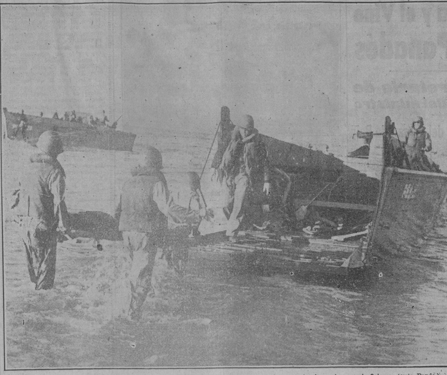
Soldados americanos transportando un herido en una camilla después de un contraataque alemán en la zona de Salerno.