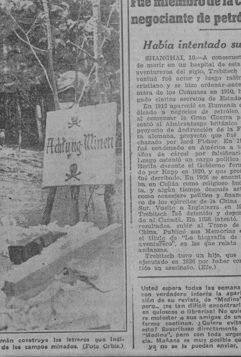
Un carpintero del Ejército alemán construye los letreros que indicarán a los soldados el peligro de los campos minados.