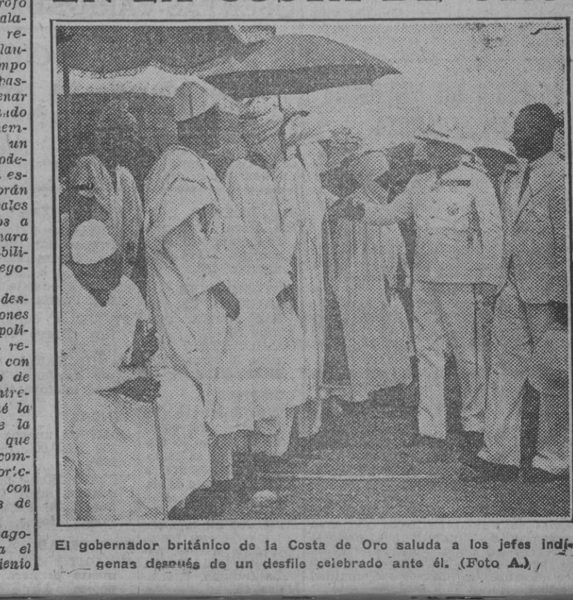
El gobernador británico de la Costa de Oro saluda a los jefes indígenas después de un desfile celebrado ante él. (Foto A.)