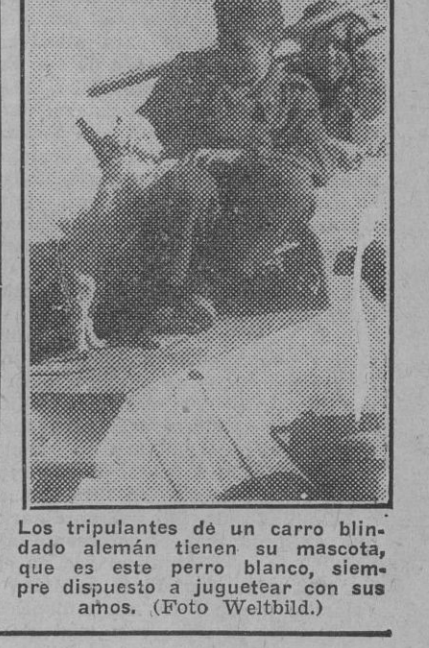
Los tripulantes de un carro blindado alemán tienen su mascota...