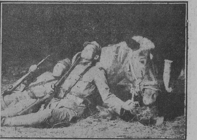
El bosque recién conquistado nos ofrecerá descanso esta noche. Duermes, compañero fiel. Seguiremos cabalgando antes de que luzca el sol.

la Victoria”), el bayo arrogante, el veterano de guerra que hace poco tiempo fué adornado por un miembro de la familia imperial en reconocimiento de los méritos contraídos por los fres coronetes que sucesivamente le montaron, habiendo caído muertos en el campo del honor. El fiel camarada de aquellos tres valien-