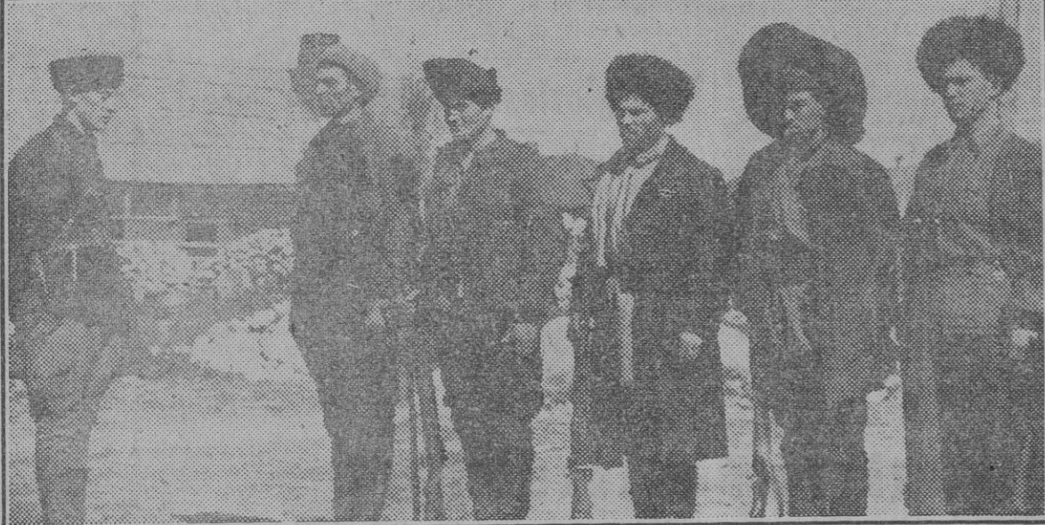
Rusos afectos a las tropas alemanas reciben instrucción de sus nuevas obligaciones.