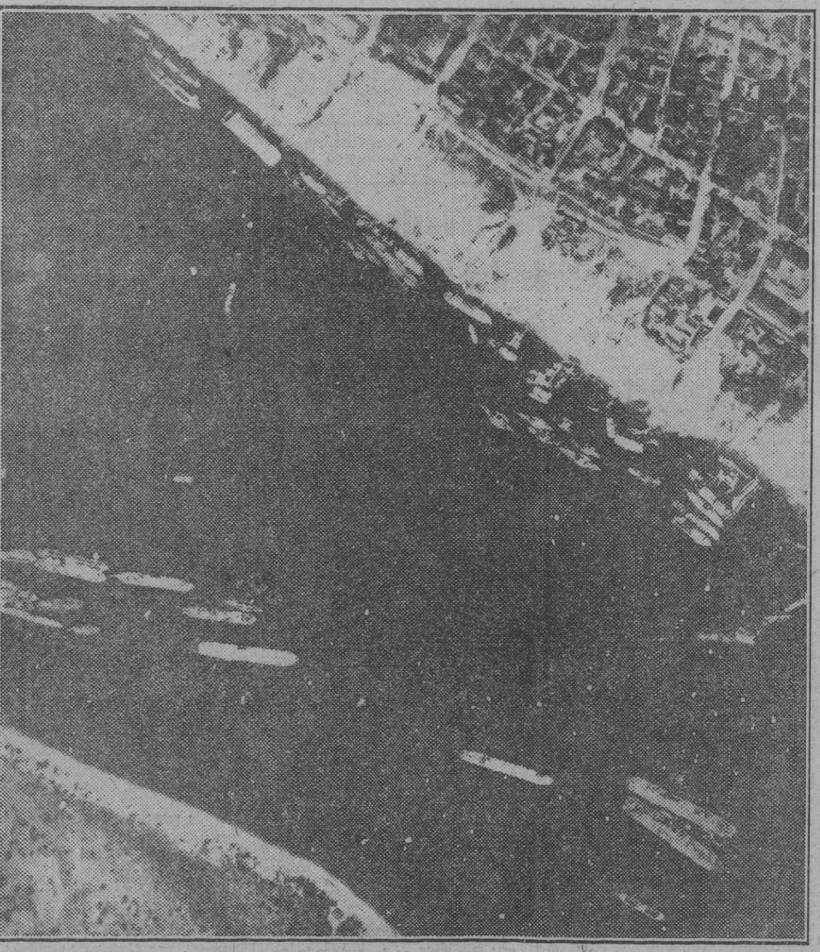
Stalingrado vuelve a ser el centro de gravedad de la guerra en el Este a causa de los ataques emprendidos por las tropas bolcheviques...