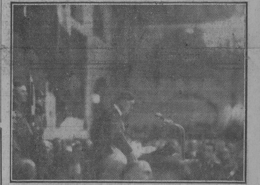
El Führer durante su discurso en la histórica cervecería Loewenbraue-Keller, de Munich.

VICHY, 9. (S. E. T.)—La ciudad de Marsella se halla desde hace dos días en estado de alarma. Las tropas estacionadas en esta ciudad y sus alrededores han recibido orden de permanecer acuarteladas. A consecuencia del ataque realizado por los anglosajones contra los puertos norteafricanos, han sido armados los aduaneros y guardias marítimos de Marsella. También en las demás plazas de la costa del Mediterráneo han sido tomadas medidas extraordinarias relacionadas con los proyectos de defensa francesa. (Efe.)