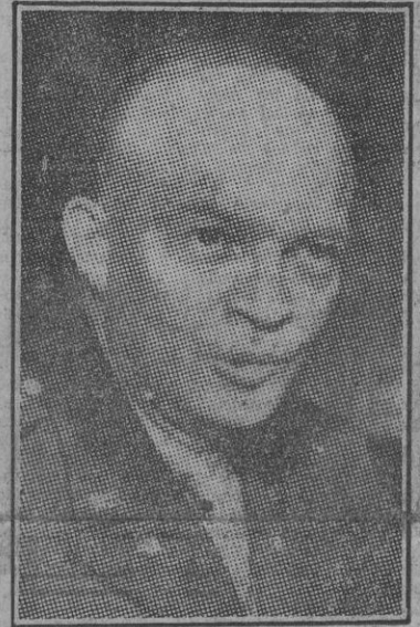
El general Eisenhower, jefe de las tropas expedicionarias norteamericanas del Cuartel General de las fuerzas de Estados Unidos establecido en Londres.