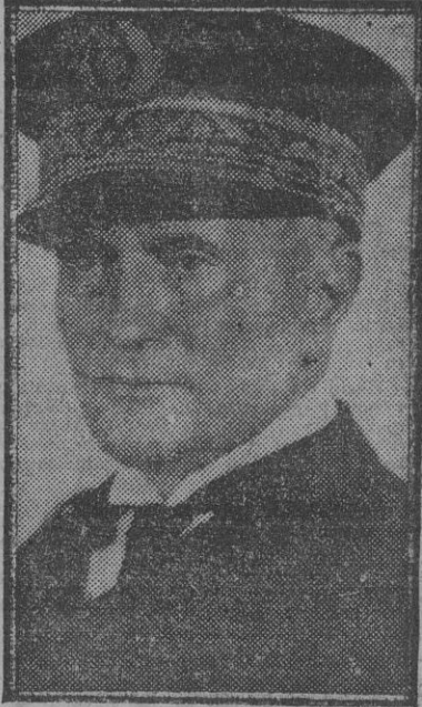
El almirante Darlan, a quien el mariscal Pétain ha encomendado la defensa de Africa del Norte y Marruecos.

El Ministerio de Asuntos Exteriores ha facilitado la siguiente nota: "En relación con las nuevas operaciones militares en el norte de Africa, Su Excelencia el Jefe del Estado y el ministro de Asuntos Exteriores han recibido del Presidente de los Estados Unidos y del Gobierno de Su Majestad británica garantía escrita de que serán respetados plenamente los territorios españoles continental e insulares, así como las colonias y el Protectorado de Marruecos, que no serán objeto de ataque ni de acto alguno contrario a nuestra soberanía, integridad e independencia. De la misma manera se respetarán los intereses españoles en general, la situación establecida en Tánger y la vigencia de los acuerdos comerciales."