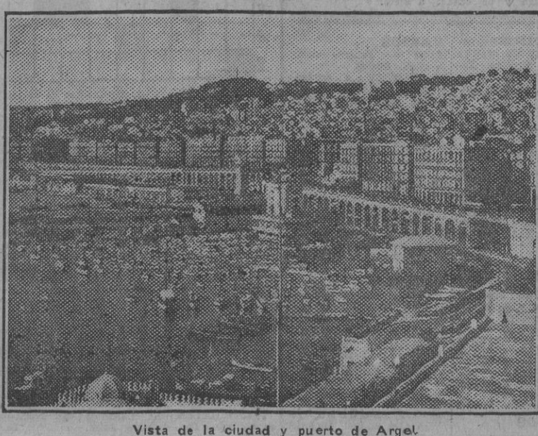
Vista de la ciudad y puerto de Argel.

Movimientos disidentes en las tropas francesas Otros comunicados publicados por el Ministerio de Información de Vichy daban cuenta de algunas disidencias surgidas entre las tropas francesas, en los siguientes términos: "Ha sido reducido un movimiento de disidencia en Casablanca. El general Bethoulet, que había pasado a la disidencia, se ha reintegrado. Salvo un batallón, todas las tropas continúan fieles a las órdenes del mariscal Pétain. Casablanca ha sido severamente bombardeada por aviones en picado. Oficialmente se desmiente la noticia divulgada por algunos radios extranjeros, según la cual se había registrado un movimiento disidente en el Marruecos francés. Tan sólo hubo algunos conatos, que fueron fulminantemente sofocados." Mientras tanto, desde Londres se dan cuenta de la forma en que se desarrollaron las operaciones de desembarco y de sus resultados, así: "En un comunicado del Cuartel General aliado del Norte de Africa se anuncia que, según las informaciones llegadas hasta el momento, los desembarcos se han efectuado con éxito, por grupos de asalto, sobre las playas del Norte de Africa próximas a los dos objetivos principales previstos en los planes. El envío de la fuerza expedicionaria fué, sin duda, la operación de transporte más largo sobre el