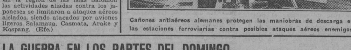
Cañones antiaéreos alemanes protegen las maniobras de descarga en las estaciones ferroviarias contra posibles ataques aéreos enemigos.