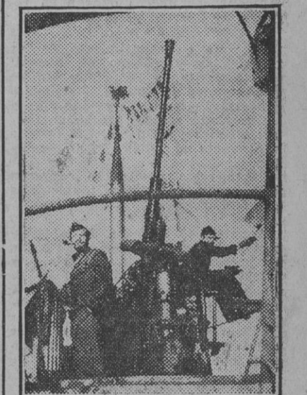
El capitán de corbeta Thurmann regresa de un crucero en el curso del cual hundió seis mercantes en una sola noche. El Führer le ha concedido la Cruz de Hierro.

todos de guerra que sigue la Gran Bretaña. (Efe.)