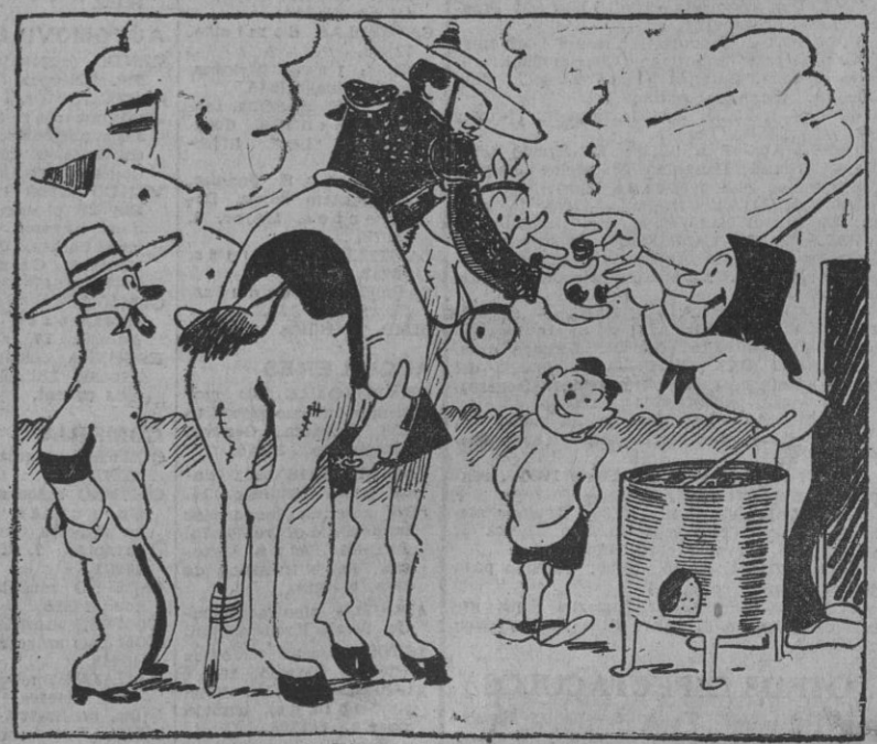
El final de la temporada taurina.

BUENOS AIRES, 26.—Algunos periódicos argentinos recogen la nota publicada por el Ministerio de Asuntos Exteriores de España para desmentir rotundamente la especie de que los submarinos del Eje se aprovisionan en las españolas. La Prensa destaca "la insistencia malévola" con que ciertas agencias informativas norteamericanas han venido propagando tales falsedades. (Efe.)