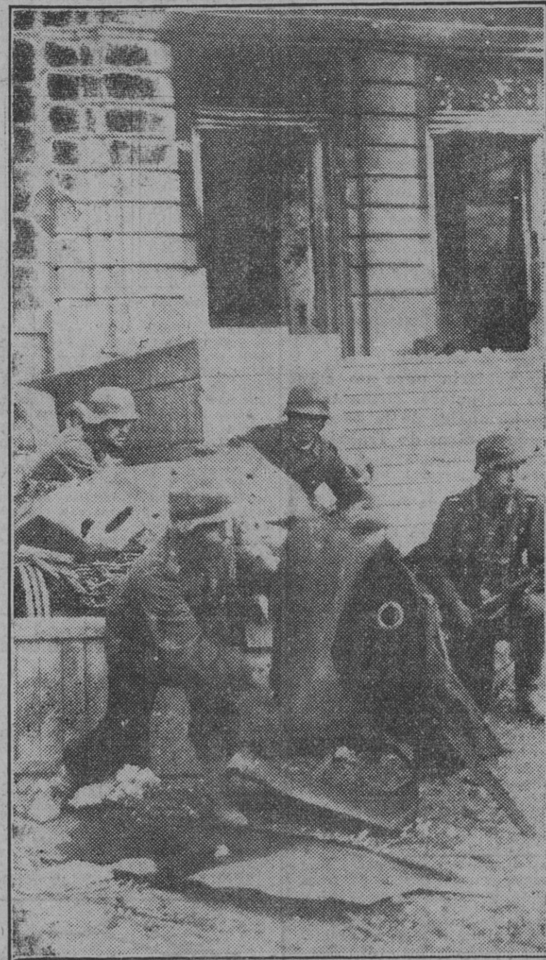
Los bolcheviques intentan atacar en una calle de Stalingrado, e inmediatamente las fuerzas alemanas se preparan para rechazarlos. Estos soldados ponen en acción una pizarra antitanque emplazada al pie de un edificio de importancia y amasacrada con trozos de material destruido al enemigo.