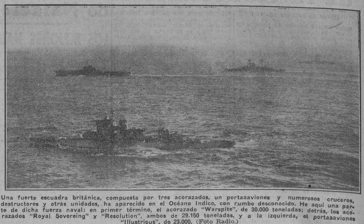
Una fuerte escuadra británica, compuesta por tres acorazados, un portaaviones y numerosos cruceros, destructores y otras unidades, ha aparecido en el Océano Índico, con rumbo desconocido...