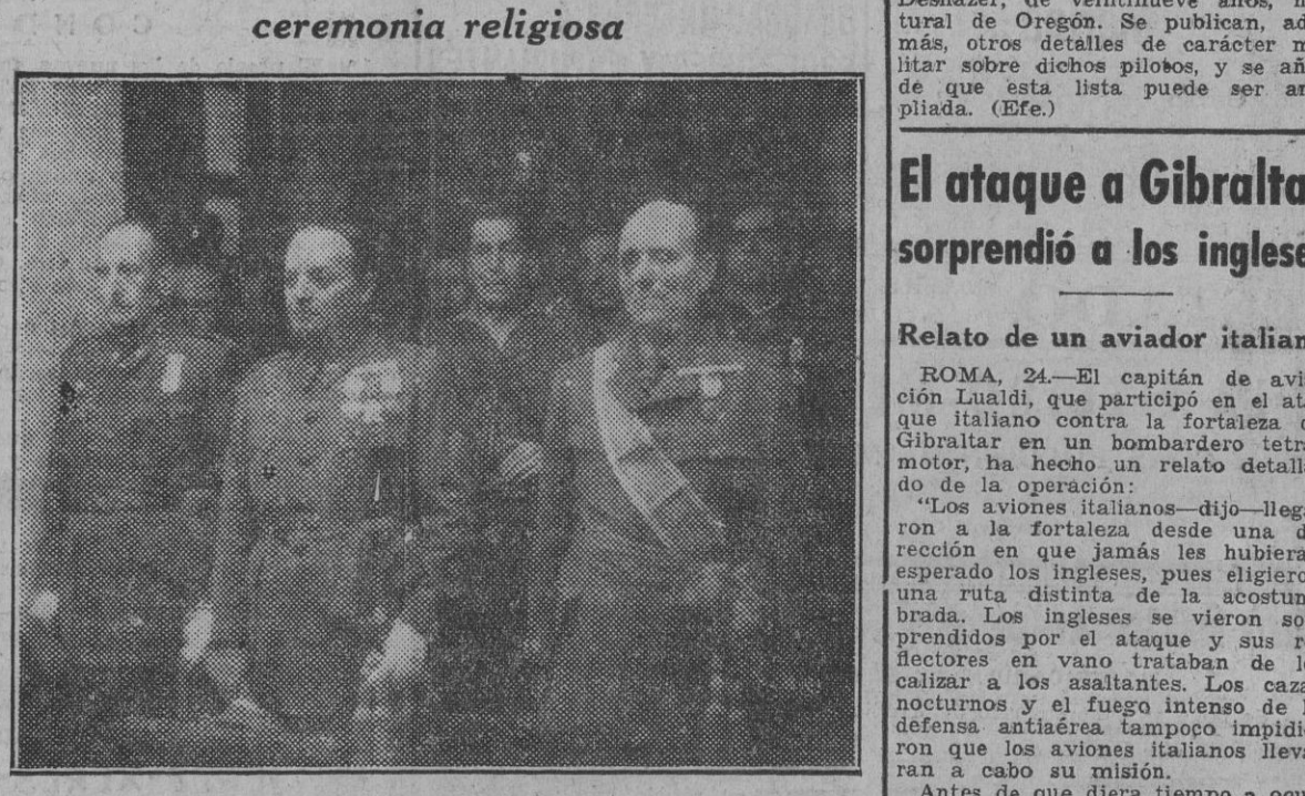
El director general de Mutilados, general Millán Astray, y otros jefes militares, durante la ceremonia religiosa celebrada esta mañana en la capilla de la Dirección General de Mutilados.

El general Millán Astray presidió una ceremonia religiosa