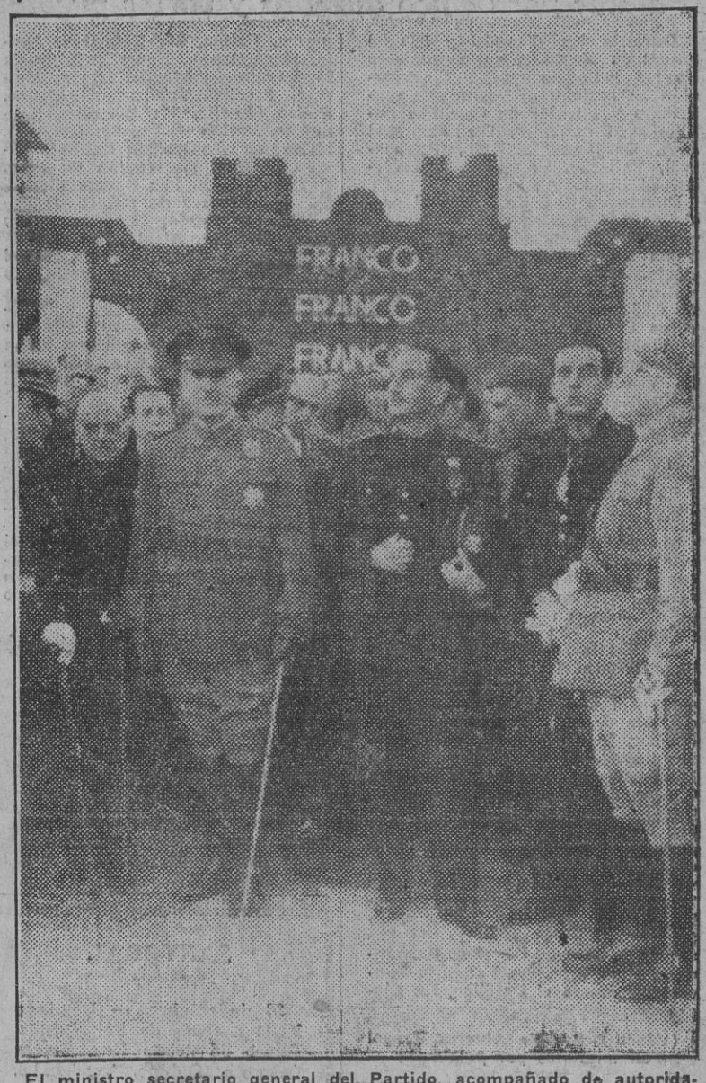
El ministro secretario general del Partido, acompañado de autoridades y jerarquías, durante su visita a la Feria de Muestras de Reus, en cuyo pabellón comercial pronunció su trascendental discurso lleno de afirmaciones nacionalsindicalistas y de normas para el mejor aprovechamiento del esfuerzo de todos los españoles en la obra común del engrandecimiento de la Patria.