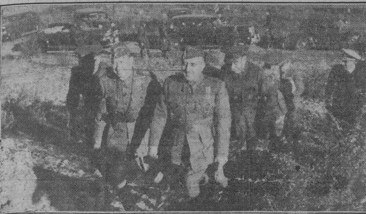
El Caudillo, acompañado de los generales Saliquet y Rada y de otras altas personalidades militares, dirigiéndose al campo de maniobras de San Pedro, de Colmenar Viejo, para presenciar el ejercicio táctico ofensivo efectuado por las fuerzas de la 13 división del Cuerpo de ejército de Guadarrama.