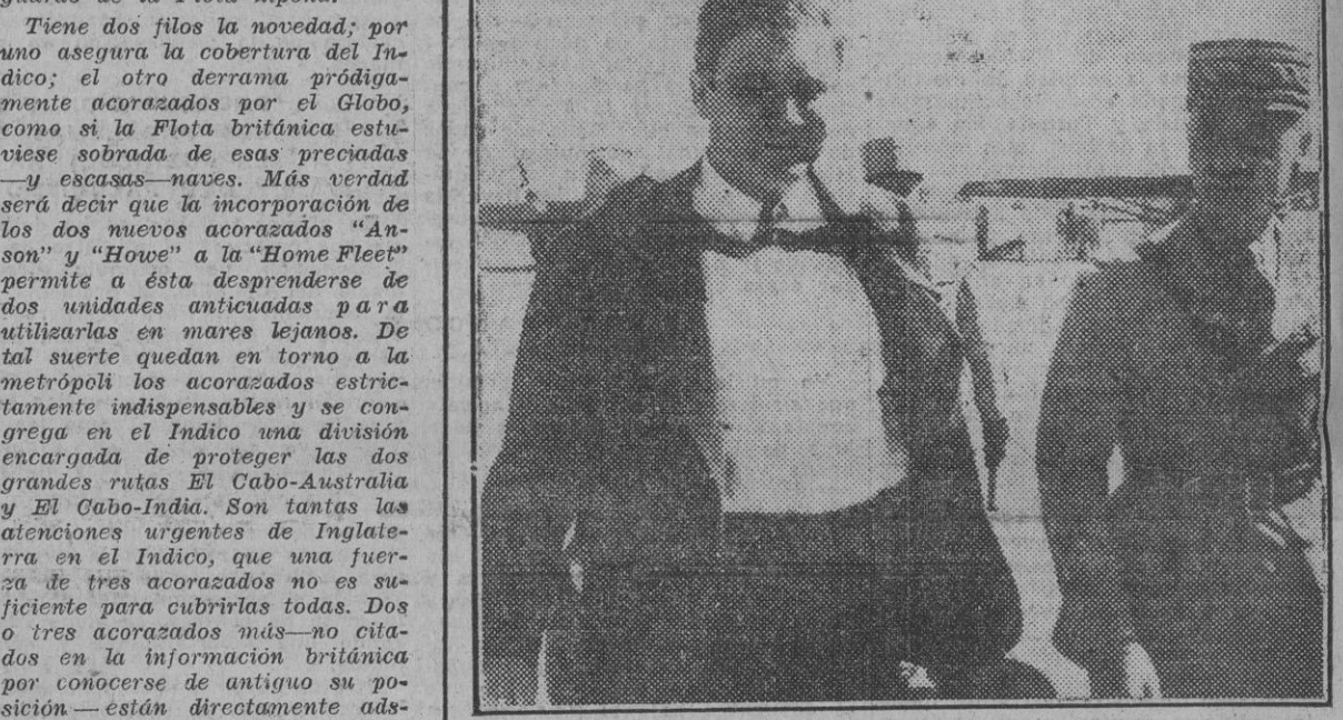
El enviado especial de Roosevelt, Wendell Willkie, con el general "degaullista" Catroux, durante la visita que hizo a Beirut.