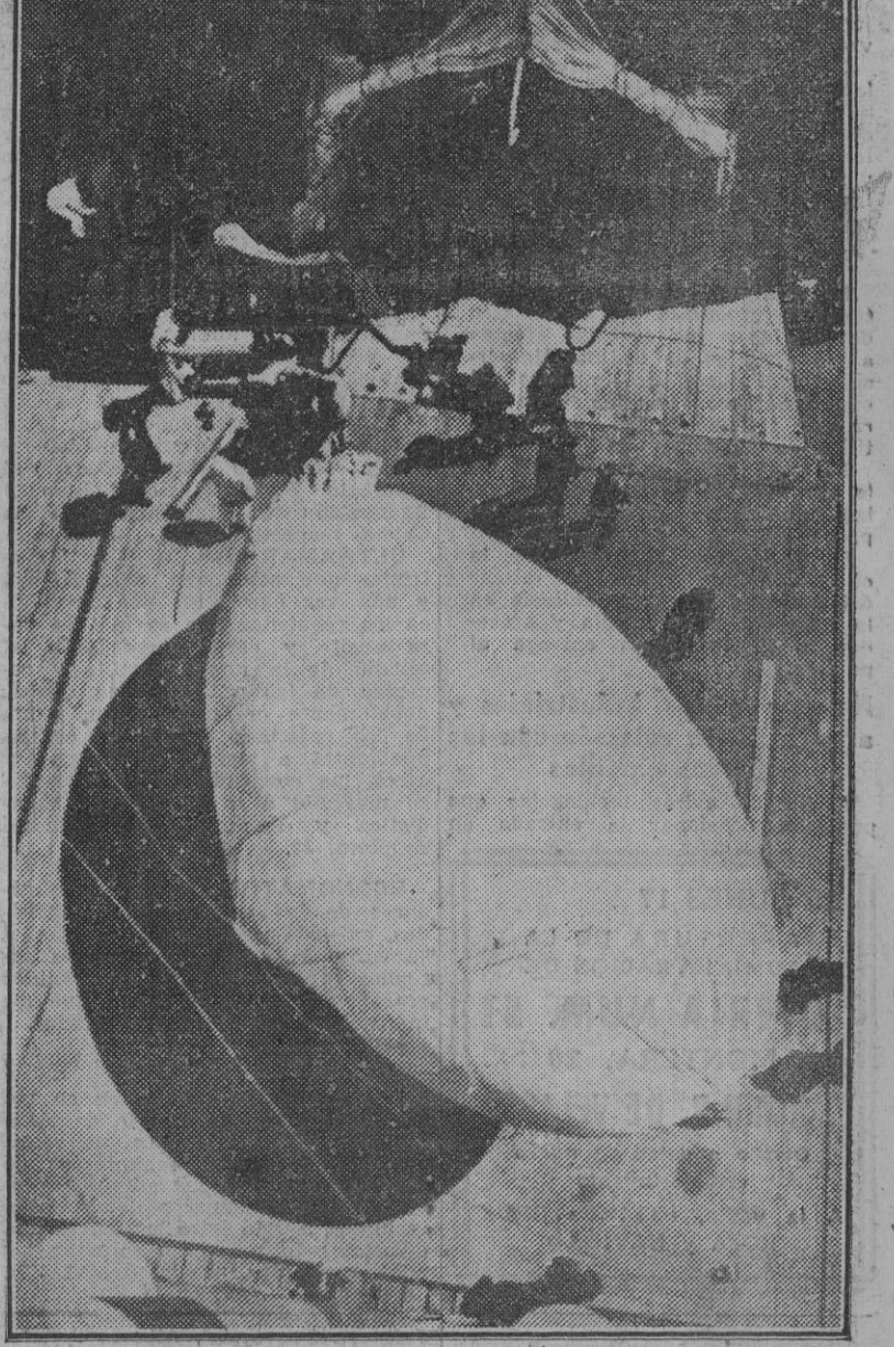
La eficacia de estos aerostatos depende mucho de la delicadeza con que se efectúe la operación de su inflaje. Una vez lleno de aire debe dársele esta forma tirante y apendada, y después se elevará hacia las alturas como un enorme monstruo volante, cautivo por un delgado hilo de seda.