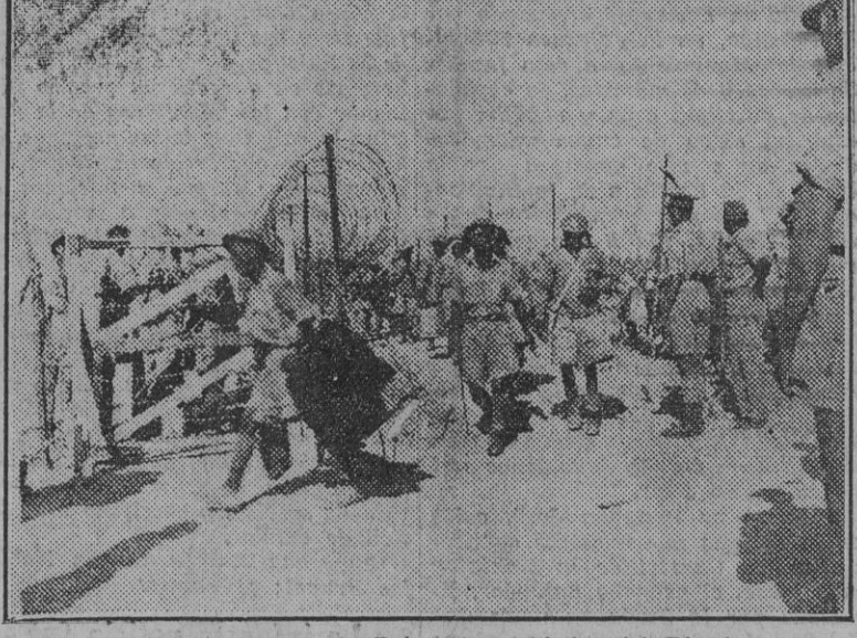
Sobre las dunas arenosas de Egipto los soldados del Eje destruyeron completamente a las unidades británicas, capturando gran número de prisioneros. En la foto, parte de estos soldados al ser incorporados a un campo de concentración de Marsa Matrúk.