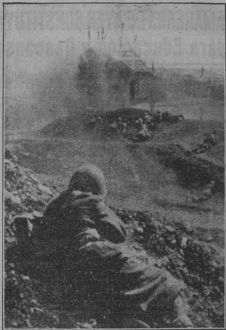
Tropas italianas que operan en el frente del Este durante el asalto a una posición rusa que fue tomada con bombas de mano.