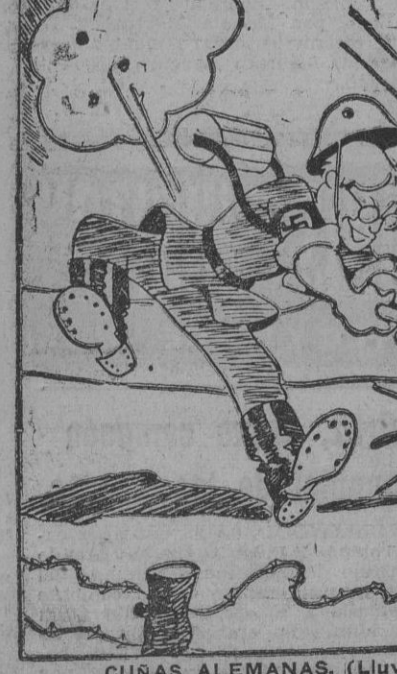
CURAS ALEMANAS. (Lluvia de gerundios, por Bellón).

España ha de salvarse por el camino del trabajo disciplinado y cotidiano, del que son resumen estas espléndidas Ferias de Muestras.