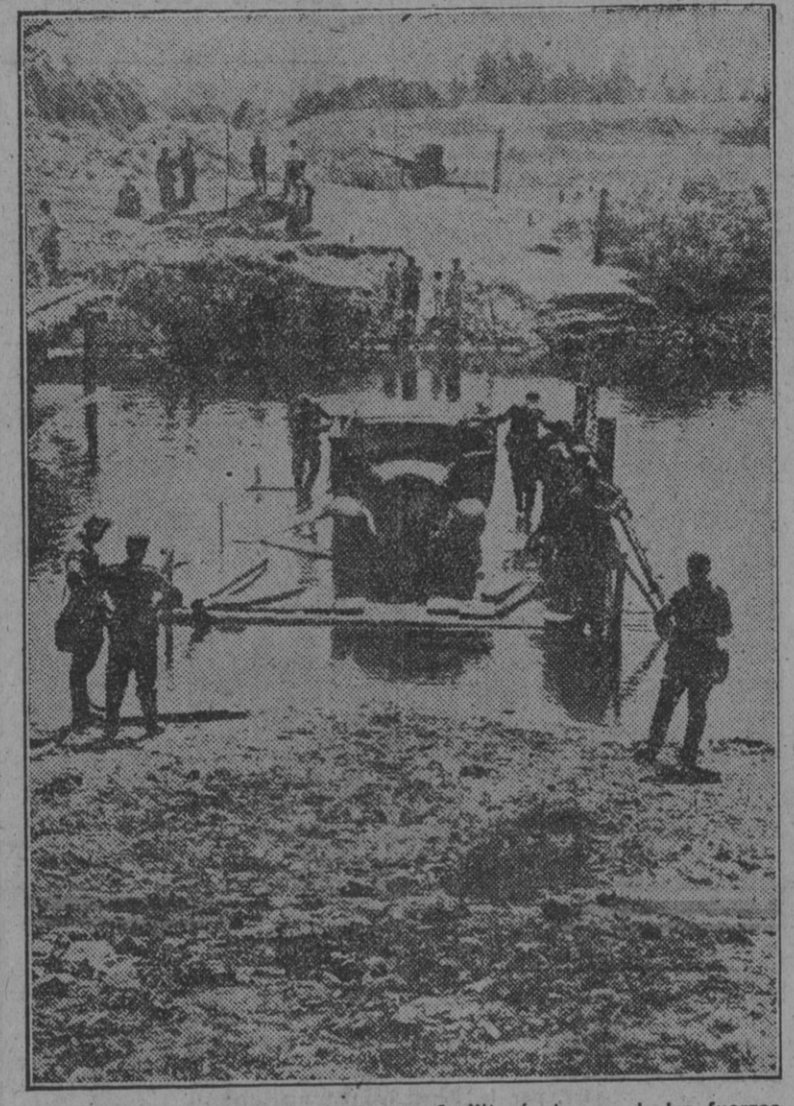
Mientras se construye el puente que facilitará el paso de las fuerzas alemanas, camiones, carros y otros elementos, franquea el río por medio de lanchas con plataformas portátiles.