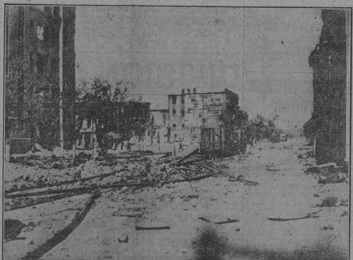
Un aspecto de la gran ciudad rusa de Vorochilovgrado horas después de caer en poder de los ejércitos del Reich. El frente se ha alejado y quedan a retaguardia las ruinas que testimonian la dureza de la lucha.