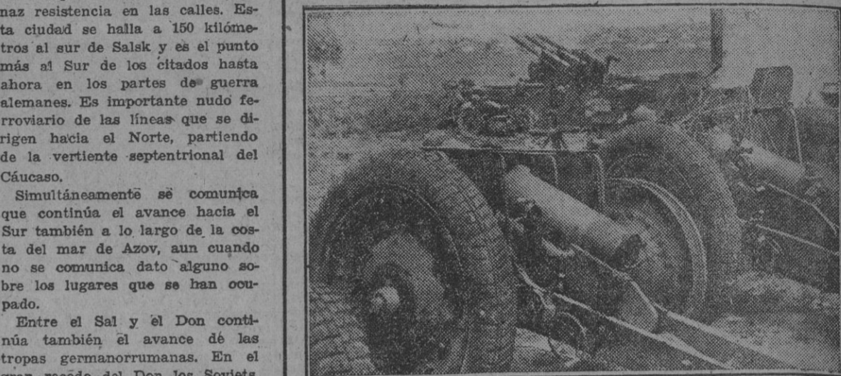
Después de la gran batalla de Rostov, en las inmediaciones de esta ciudad fué recogida gran cantidad de material de guerra abandonado por los rusos en su huida.