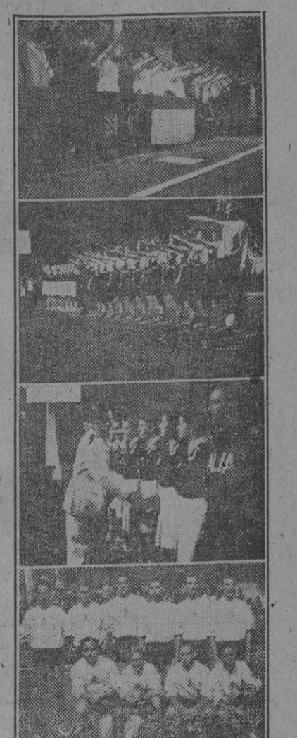
Del reciente encuentro internacional de baloncesto femenino en la C. U.—La presidencia. Los equipos aliados en el centro de la cancha. El jefe nacional del Sindicato Español Universitario saluta a las jugadoras. El equipo masculino universitario de Madrid vencedor del campeón de España.