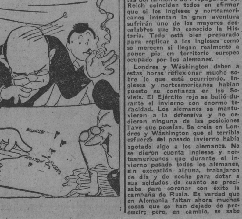
La ofensiva sigue su curso, y ya abona dónde Kubán.