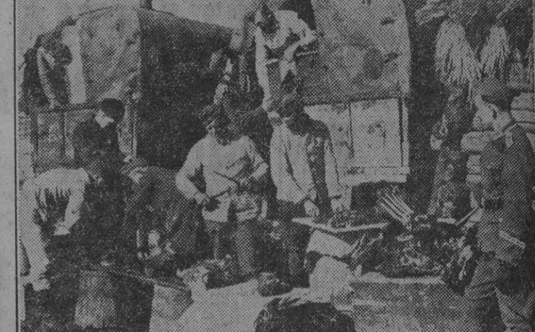
Camiones de Intendencia del Ejército alemán llevan a las trincheras los viveres para los soldados que en vanguardia luchan contra el enemigo.