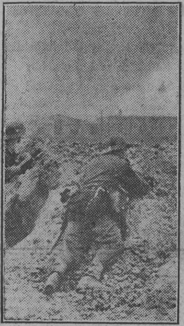
Fuerzas ligeras de Infantería desfilan con granadas y ciertos disparos de fusil a pequeños grupos enemigos que aún resisten al amparo de algunas edificaciones sólidas.