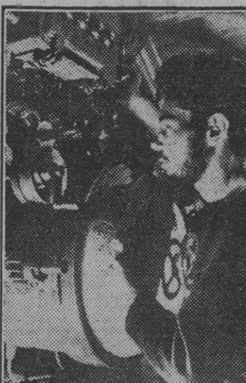
En el interior del submarino se recibe el aviso de "Barco a la vista". La orden de zafarrancho se da al instante y los tripulantes de la nave se aprestan al ataque.