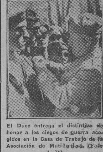
El Duce entrega el distintivo de honor a los ciegos de guerra acogidos en la Casa de Trabajo de la Asociación de Mutilados.