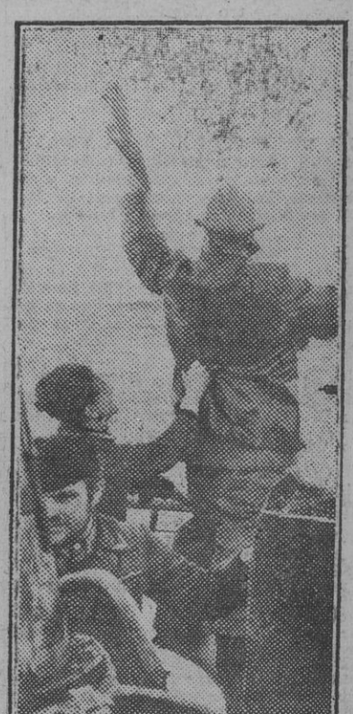
Después de haber disparado toda la dotación de torpedos, hundiendo otros tantos buques enemigos, la tripulación del submarino saluda gozosa la aparición en el horizonte de la costa alemana.