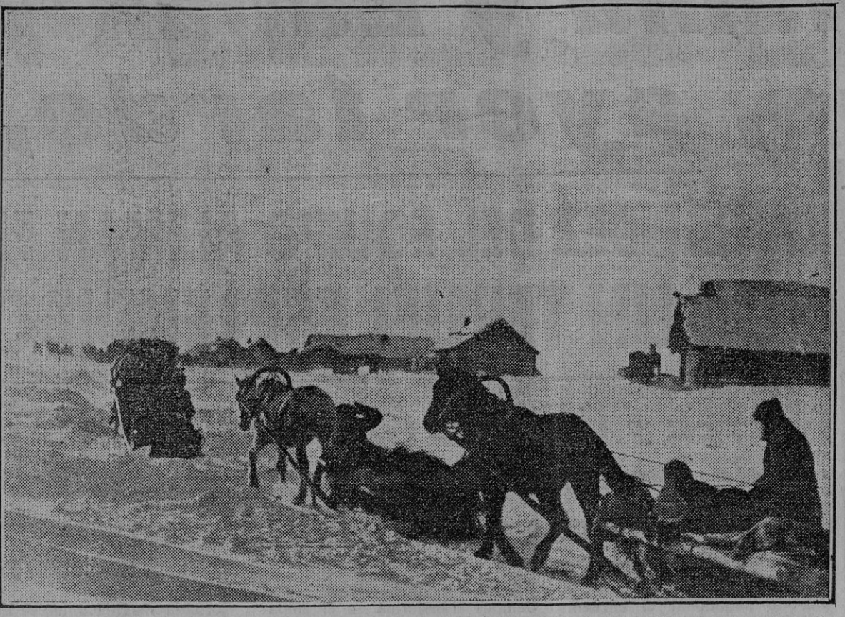
Estos carros conducen las provisiones de los soldados alemanes destacados en las posiciones avanzadas del sector central ruso.