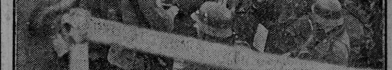
El día 9 se cumplieron dos años de la iniciación de la campaña alemana en Noruega. La foto muestra el momento del desembarco en las costas noruegas de las primeras fuerzas de infantería.