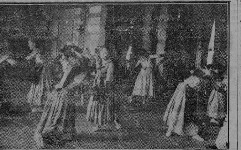
Ejercicios de gimnasia rítmica efectuados por nuestras camaradas de la Sección Femenina en el acto inaugural del II Campeonato de Gimnasia, celebrado hoy en el Círculo de Bellas Artes.

LA SESION INAUGURAL SE HA CELEBRADO ESTA MAÑANA