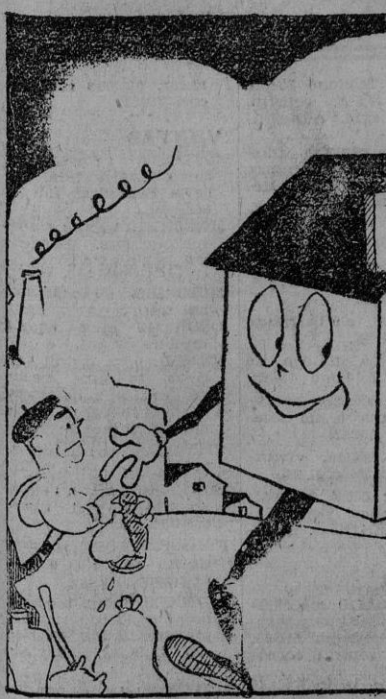
PRODUCTORES Y COMPRADORES, por Bellón. Un buen intermediario.