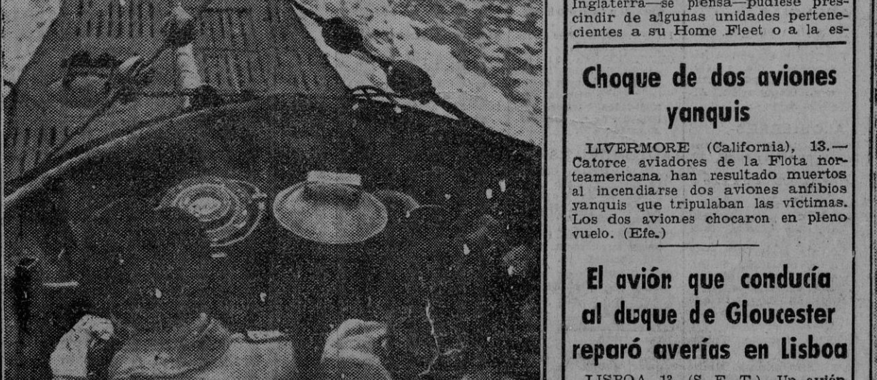
Desde la torreta del submarino los valientes marinos del Reich buscan el horizonte buscando nuevas presas enemigas.