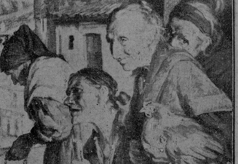
"Hacia la ermita", uno de los bellos cuadros que figuran en la Exposición de Ismael Blat, en el salón de Museos y Bibliotecas.