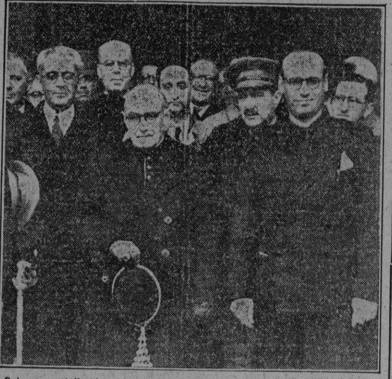
Salamanca tributó una cariñosa despedida al nuevo primado. He aquí al doctor Pla y Deniel, acompañado de las autoridades, momentos antes de abandonar la capital salmantina.

Esta tarde, a las tres, se trasladó a Toledo para asistir al acto de la entrada del Cardenal Primado, doctor Pla y Deniel, el ministro de Justicia, don Esteban Bilbao.