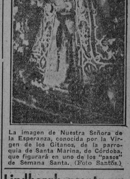
La imagen de Nuestra Señora de la Esperanza, conocida por la Virgen de los Gitanos, de la parroquia de Santa Marina, de Córdoba, que figurará en uno de los "pasos" de Semana Santa. (Foto Santos).