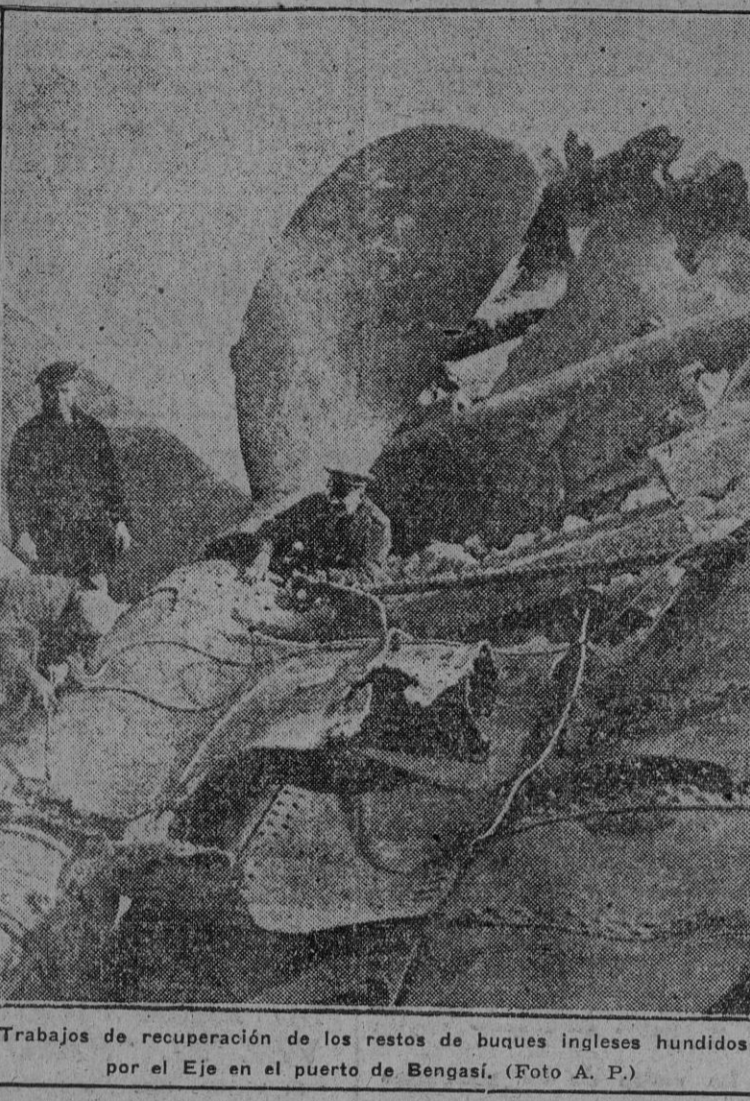
Trabajos de recuperación de los restos de buques ingleses hundidos por el Eje en el puerto de Bengasi.