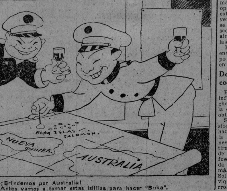
—¡Bridemos por Australia! —Entendamos a tomar estas islas para hacer "Buka".

Por la noche el Rey Boris fué huésped del ministro de Negocios Extranjeros, Von Ribbentrop, en su residencia. Hoy, 25, el Soberano búlgaro visitó al ministro del Reich Hermann Goering. (Efe.)