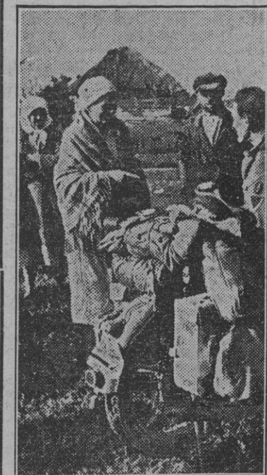
La población campesina rusa conserva su natural sencillez y puede ser la base de un régimen regenerador. La acogida cordial dispensada al Ejército del Reich demuestra hasta qué punto se halla libre del virus soviético.

TOKIO, 15.—La palabra japonesa "kyokuto" ha sido suprimida del vocabulario oficial por disposición gubernamental y los particulares han sido invitados a prescindir de ella en sus con-