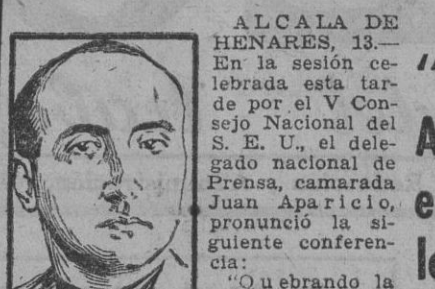
ALCALA DE HENARES, 13.—En la sesión celebrada esta mañana...