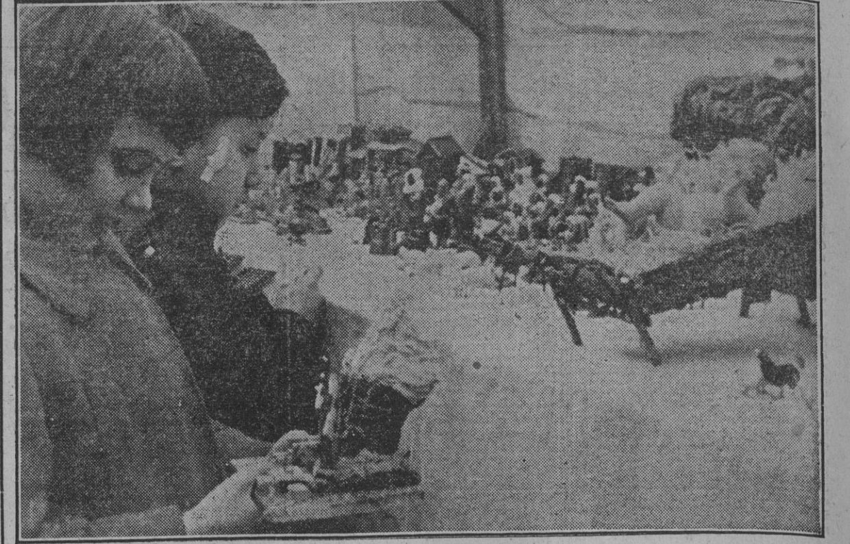
Los puestos de venta de Nacimientos han reaparecido ya en toda España como núcleos emotivos y evocadores de innumerables fiestas pasadas. Ante ellos los pequeños viven horas de éxtasis admirando las diminutas edificaciones, los ríos de papel de plata, los panoramas nevados y las figuras que tallaron anónimos artifices. Y el corazón de los adultos se satura de paz y de místico fervor.