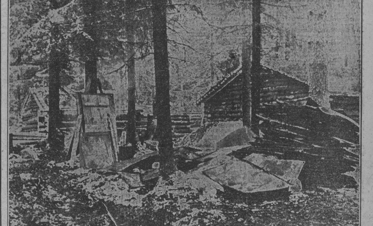
Las brigadas de trabajo alemanas construyen activamente cuarteles de invierno para las fuerzas del Reich. Las viviendas son de madera, material aconsejado por sus condiciones térmicas a los climas del Norte. El número de viviendas habilitadas es inmenso, tanto por su facilidad de construcción como por las pésimas condiciones higiénicas de las aldeas soviéticas, incapaces de albergar a los soldados.