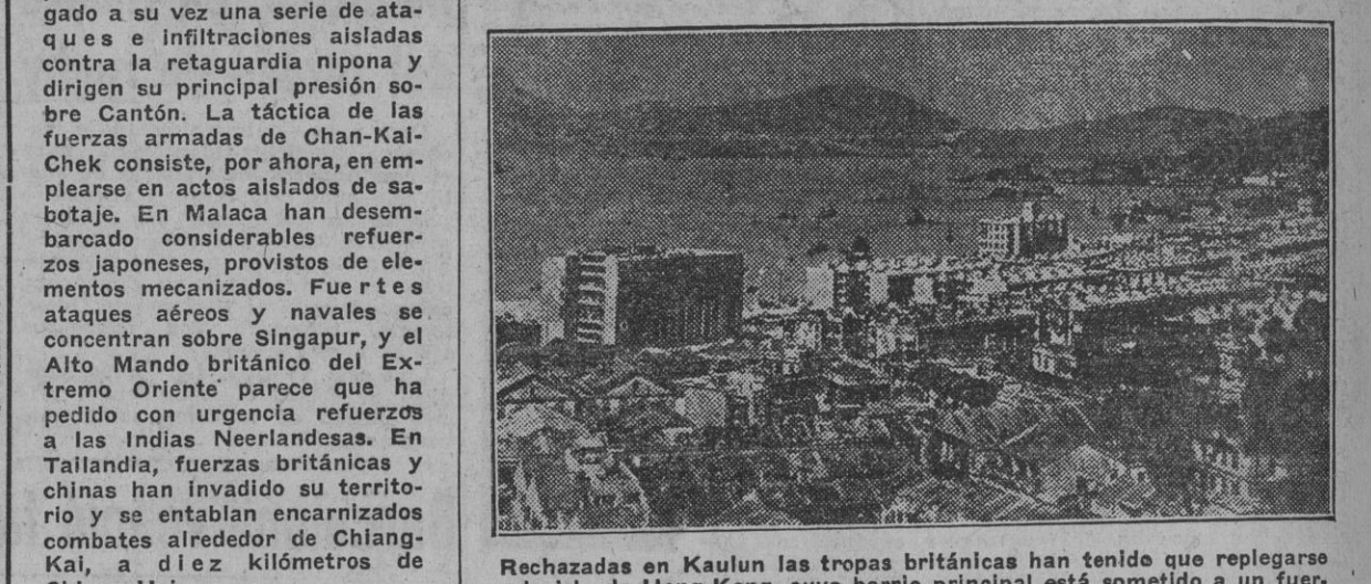
Rechazados en Kaulun las tropas británicas han tenido que replegarse a la isla de Hong-Kong, cuyo barrio principal está sometido a un fuerte cañoneo japonés.

La ofensiva general japonesa contra la importante base de Hong-Kong ha comenzado ayer, después de intimar a la rendición a los defensores de la plaza. Los chinos han desplegado a su vez una serie de ataques e infiltraciones aisladas contra la retaguardia nipona y dirigen su principal presión sobre Cantón. La fábrica de las fuerzas armadas de Chan-Kai-Chek consiste, por ahora, en emplearse en actos aislados de sabotaje. En Malaca han desembarcado considerables refuerzos japoneses, provistos de elementos mecanizados. Fue en esta ocasión que las tropas se concentran sobre Singapur, y el Alto Mando británico del Extremo Oriente parece que ha pedido con urgencia refuerzos a las Indias Neerlandesas. En Tailandia, fuerzas británicas y chinas han invadido su territorio combates alrededor de Chiang-Kai, a diez kilómetros de Chiang-Hai.