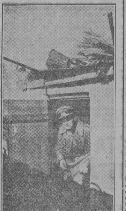
El general Von Kleist, de la "Panzerarmee", sale de su puesto de mando en el frente oriental.