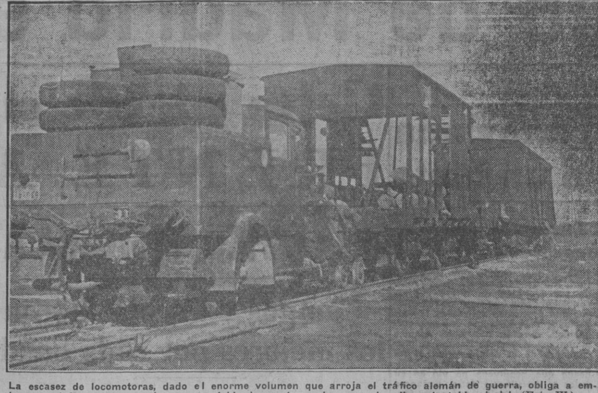
Las escases de locomotoras, dado el enorme volumen que arroja el tráfico alemán de guerra, obliga a emplear en defecto susy camiones con doble juego de ruedas, uno de ellos adaptable al riel.