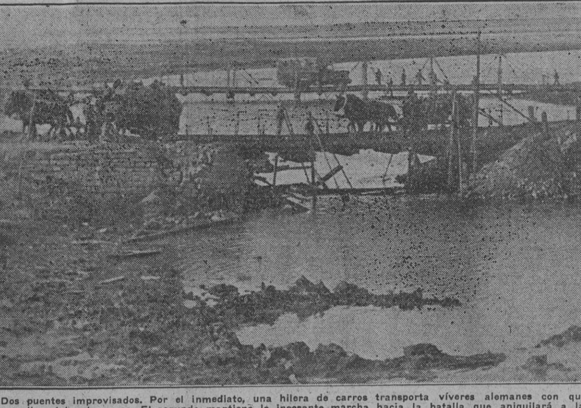
Dos puentes improvisados. Por el inmediato, una hilera de carros transporta víveres alemanes con que remediar el hambre rusa. El segundo mantiene la incesante marcha hacia la batalla que aniquilará a la horda roja.