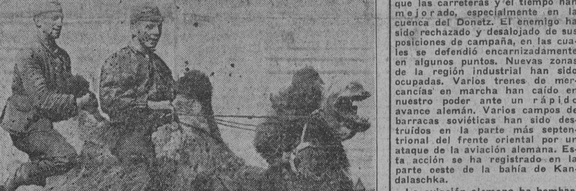
En la llanura meridional han encontrado por primera vez los soldados del Reich camellos, que los indígenas utilizan como cabalgaduras. Adiestrándose como mejor pueden sorprende la fotografía a los combatientes alemanes.