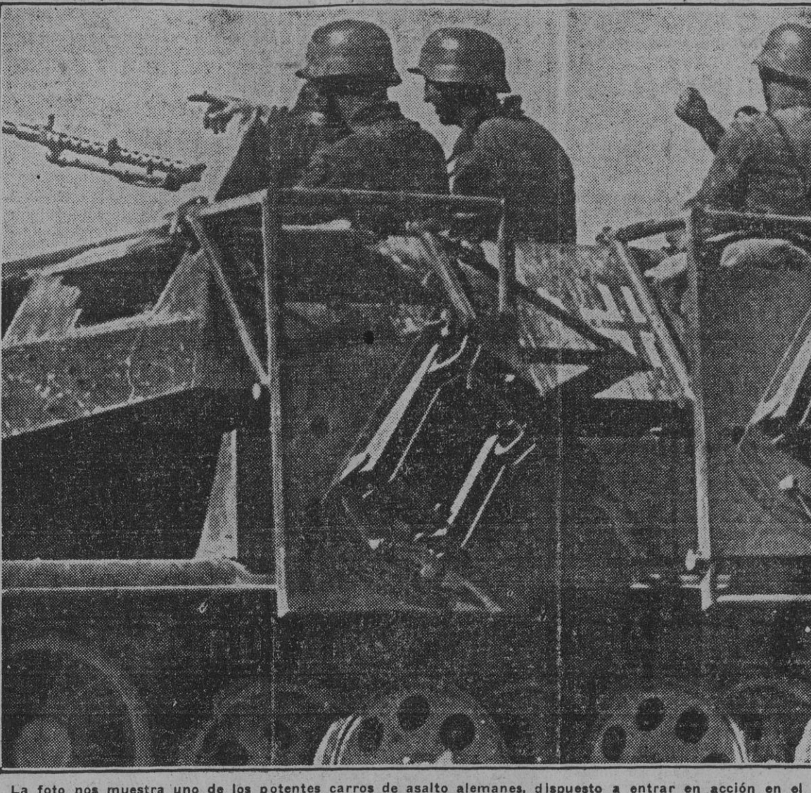
La foto nos muestra uno de los potentes carros de asalto alemanes, dispuesto a entrar en acción en el frente ruso.