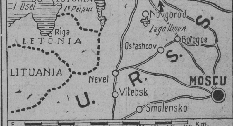
Las flechas indican la enorme presión que el ejército germanofilín efectúa alrededor de San Petersburgo, librando batallas de efectos desastrosos para los soldados de Vorochilov.