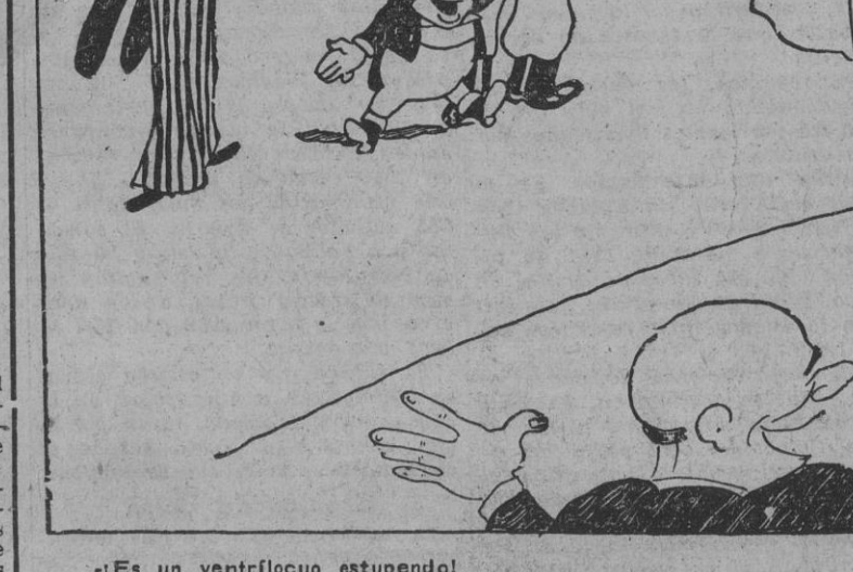
—¡Es un ventrílocuo estupendo! —¡Sí, habla con el estómago, a agradecerlo!