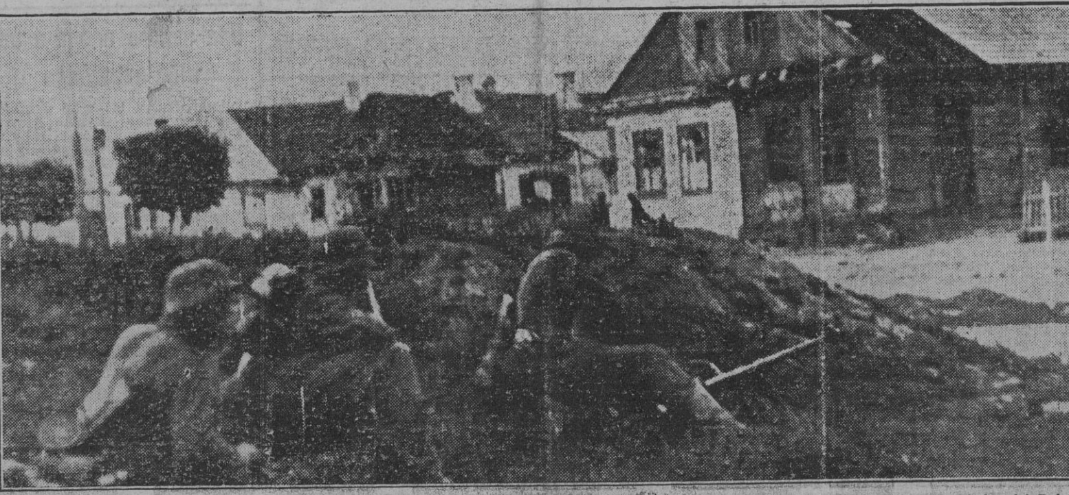
Esta ciudad roja, cuya entrada da una sensación de pueblo pacífico vigilado por soldados alemanes, es uno de tantos arroyos de guerra, ya que, tras de estas típicas casas rurales se encuentran muchas veces fortificaciones poderosas, y hasta de las mismas ventanas disparan los rojos sus ráfagas de ametralladora contra los soldados del Reich. Pero es difícil sorprender al Ejército alemán, ya que sus fuerzas de choque prontamente deshacen el ardid soviético con bombas de mano, que siembran la muerte y dispersan al enemigo.