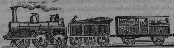
FERRO-CARRILES DE MALLORCA.

un predio denominado SON SELETAS con casa rústica y urbana, almazara y otras dependencias, situado en el término de Marratxi, confinante con la antigua carretera de Binõla á distancia de pocas mas de una legua de Palma: mide algo más de 26 cuarteradas 3 cuarterones y se halla poblado de olivos, algarrobas, almendros y otros frutales. Para su adquisicion podrán avistarse con D. Guillermo Llabrés, calle de la Union, núm. 93. 14