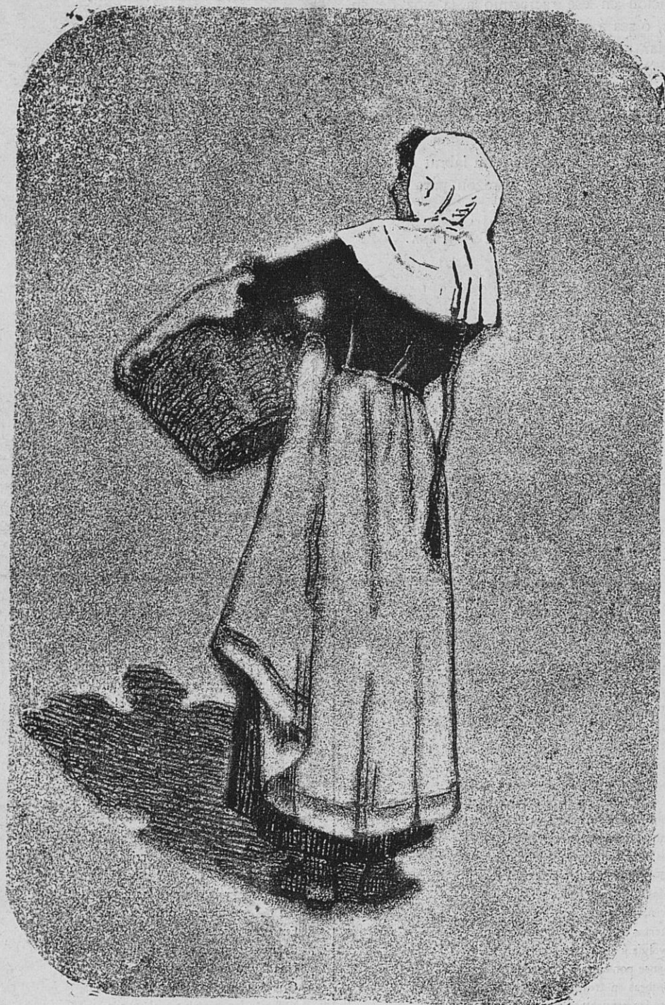
UNA PAYESA MALLORQUINA.

(Estudio del natural por D. Antomo Fuster.)