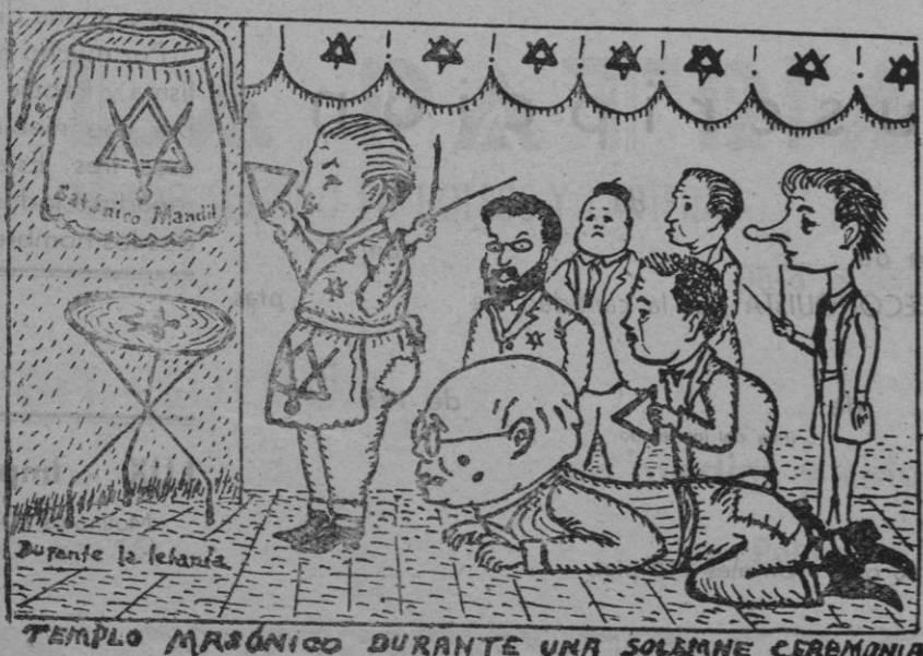
Durante la letanía. TEMPLO MASÓNICO DURANTE UNA SOLEMNE CEREMONIA