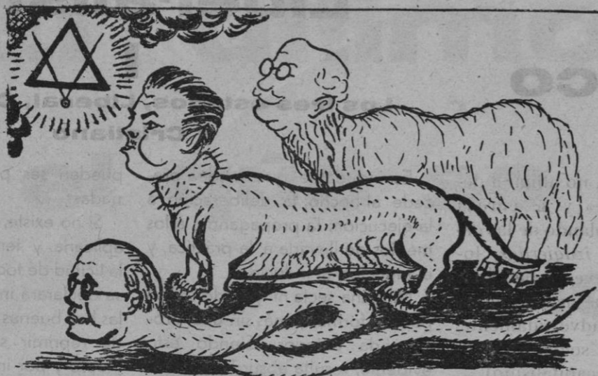
Idólatras del triángulo, vezando el "eredo."