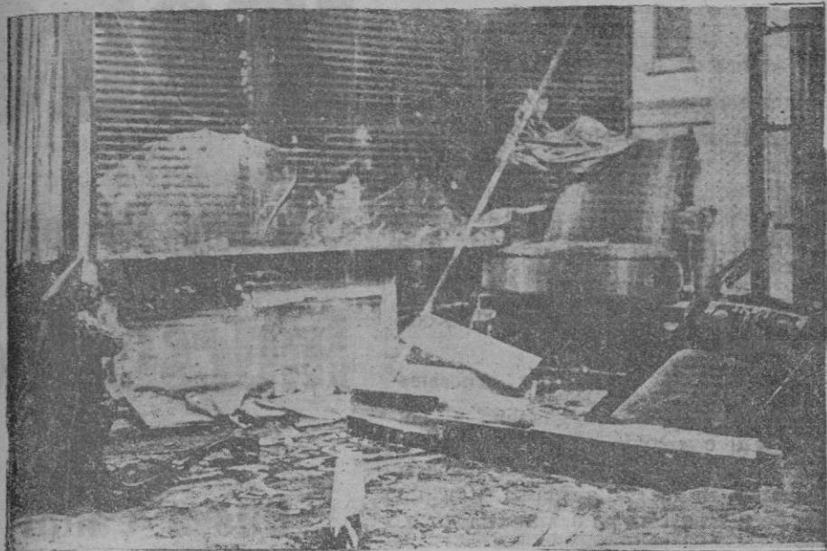
Aspecto de los destrozos causados por una de las bombas que estalló en una tienda del paseo de Gracia