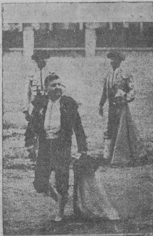
El veterano diestro recogiendo los últimos aplausos en su arriesgada profesión

el de la amistad ingenua de una compañera de su niñez que compartía con él sus juegos infantiles.