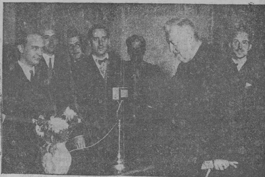
El Doctor Eckener, saludando por la radio al pueblo de Barcelona