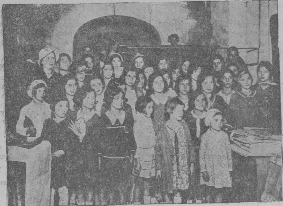
Las niñas de las escuelas nacionales de Son Servera visitando los talleres tipográficos de la Casa Amengual y Muntaner