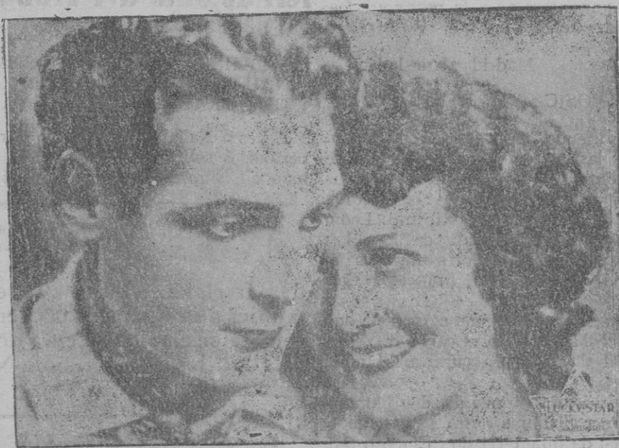
Charles Farrell-Janet Gaynor

La historia de un hombre que fué a buscar lejos el amor... sin darse cuenta que lo tenía a su lado