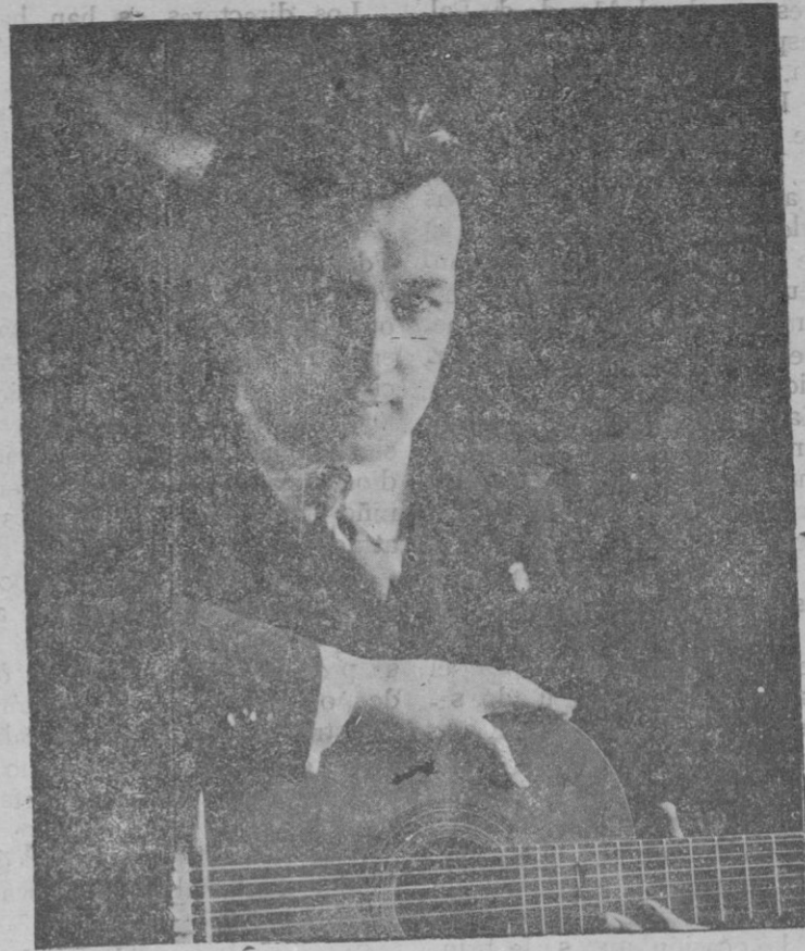
Eminente concertista de guitarra que mañana miércoles, a las siete, dará un concierto en el Salón Mallorca

Alady con el bombín en su mano enguantada y exclama: Deu vos guard...!, resonando una general cajada.