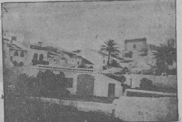
Alayor.—...unas palmeras gigantes acudían al frente del cortejo, cimbreándose galana y señorilmente.

de Comunión general. A las diez y media, Misa solemne y panegírico del Santo por el mismo orador sagrado. Después de la Misa se expondrá el Santo. Por la tarde, a las seis y media, Rosario, sermón por el mismo orador de la Novena, Te-Deum y bendición. Después de la reserva adoración de la Reliquia del Santo. A. M. D. G. El primer día de Triduo de Cuarenta Horas harán vela los congregantes del Sagrado Corazón; el segundo las Madres Cristianas; el tercero los congregantes de la Presentación y San Alonso.