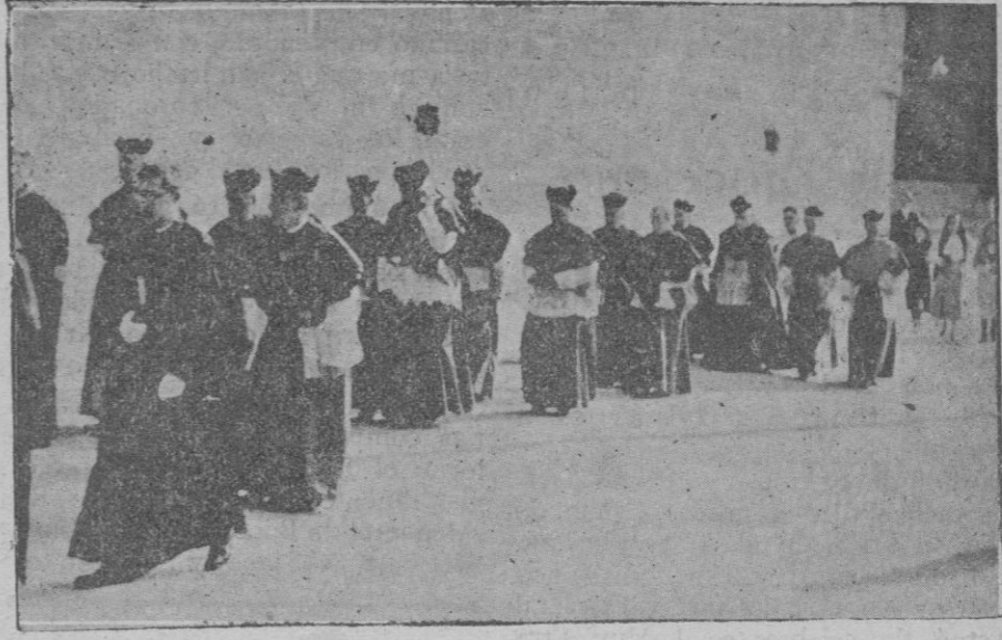
El Excmo. y Relmo. Sr. Arzobispo-Obispo de Mallorca Dr. Miralles al dirigirse a la Catedral el día de la inauguración del Sínodo.

dadosa, siempre con ojo avizor velando amante sobre la isla entera, con gesto maternal, inmenso. Detrás de nosotros, el mar teñía sus encajes de espuma cabe el encanto de mil cas argentadas. Y mientras el ojo se embelesaba en la suave visión, el prócer, señalando las blancas masías de los «llocs» iba vertiendo en mis oídos un hilo fragante de nombres sonoros y perfumados con aromas de pebetero oriental: Binidunaiet, Binifanis, Binimarzoch, Binixabó, Binifabini, Biniadris, Binichemis, Binijafnó... Manuel ANDREU FONTIRROIG