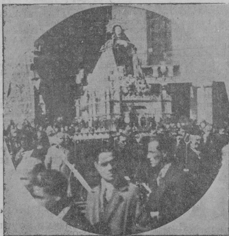
La imagen de la Santa al ser llevada en la solemne procesión que recorrió las calles de Avila

barcas embarrancadas en la arena simulando un puerto formal. ¿Cómo resplandecía la luz del sol en la hora meridiana! Era como si Mallorca, al aproximarse a Argel y a Sicilia, perdiese su sentido de contención y se abandonase a la violencia. El mar pronunciaba su azul exagerado, y el mismo viento batía con un júbilo vehemente, como pidiendo galeras de guerra que empujar. Calarratjada, con su nombre áspero y marino! Y allí estaba el marinero más auténtico y representativo de todo el Mediterráneo.