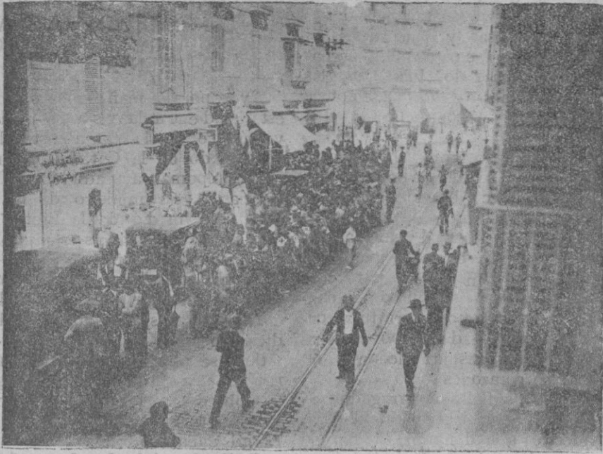
Al desfilar por la calle de Palacio, dirigiéndose a la Diputación