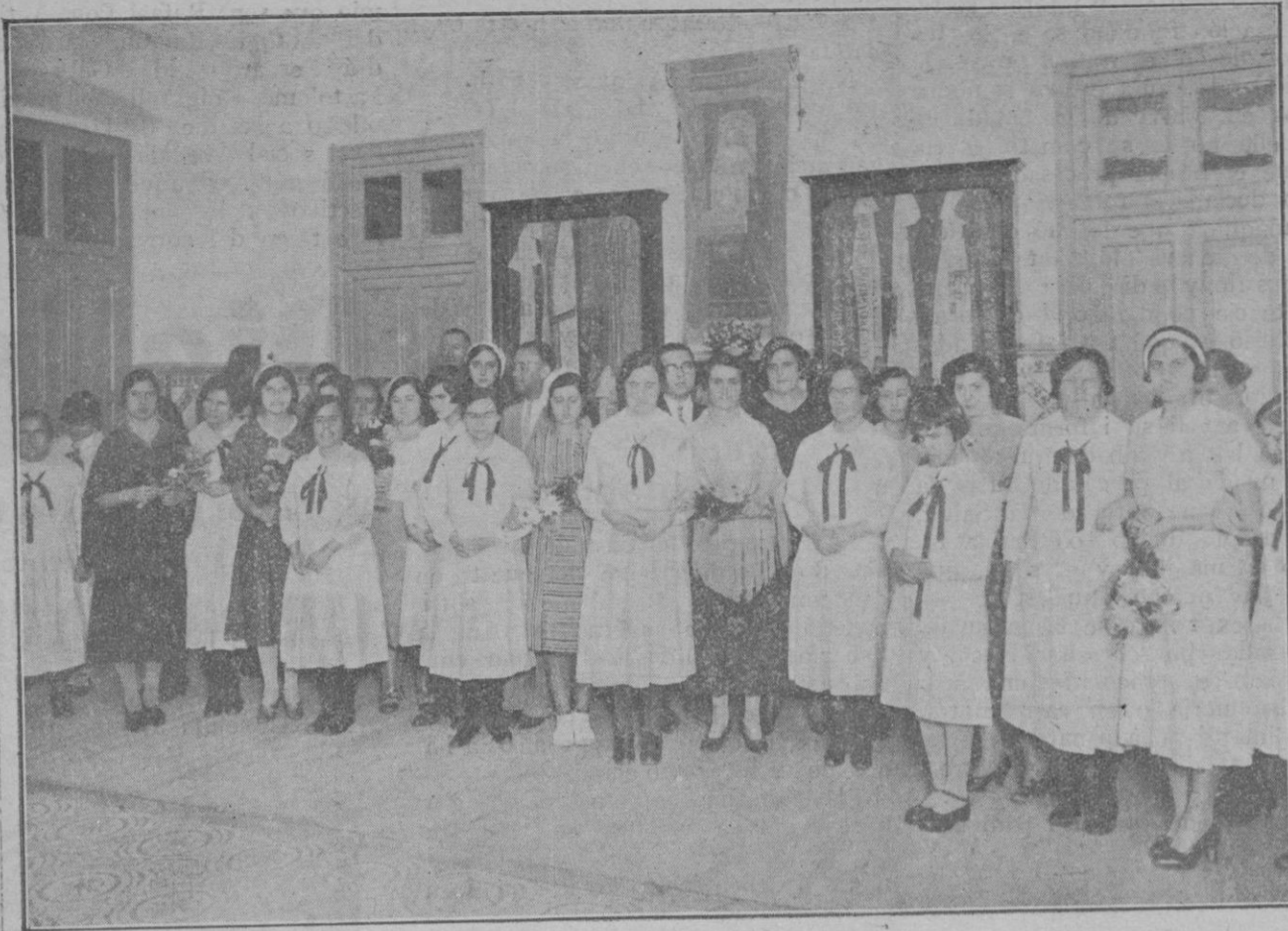
Las cieguetas del «Amparo de Santa Lucía» (organismo de la Caja de Pensiones) acompañadas de las señoritas de Petra que fueron a Barcelona para hacerles entrega de un obsequio adquirido por suscripción popular