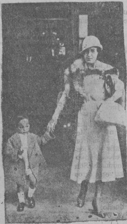
El hijo del Sultán de Marruecos paseando por París en compañía de su institutriz francesa