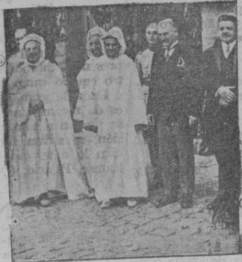
El Sultán en Rambouillet con el Presidente de la República y el Jefe del gobierno francés M. Herriot