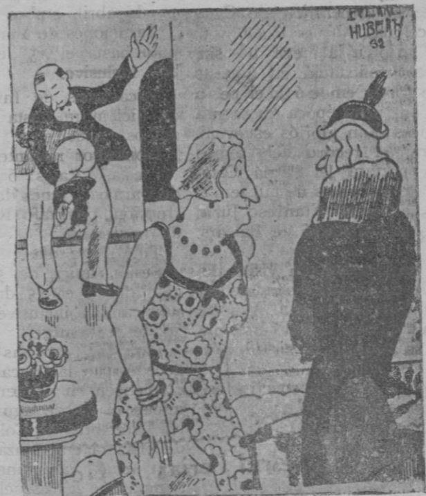
La señora (a la criada nueva).—Aquí la trataremos lo mismo que a nuestro hijo.