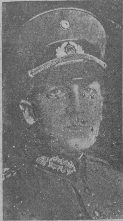
El general Schleider, ministro de la Guerra de Alemania, cuya acción contra los hitleristas está siendo objeto de la atención mundial