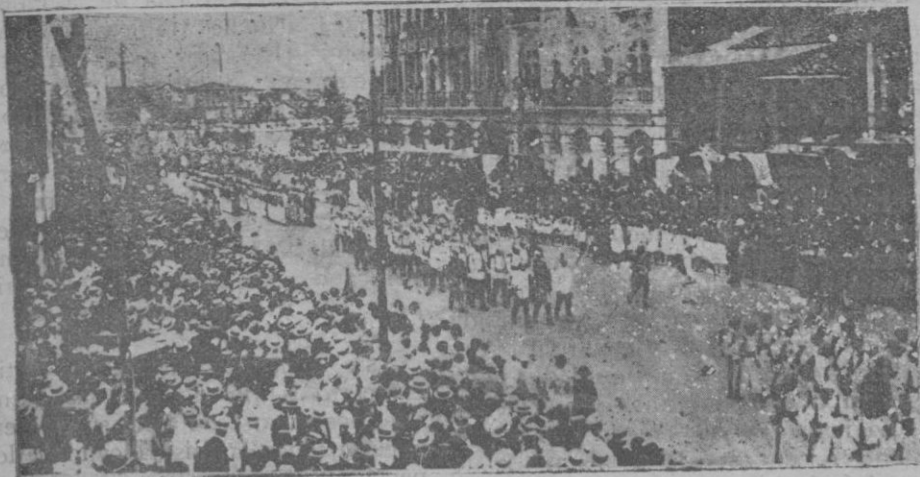
Una de las plazas de Quito al desfilar las tropas enviadas por el gobierno contra los rebeldes