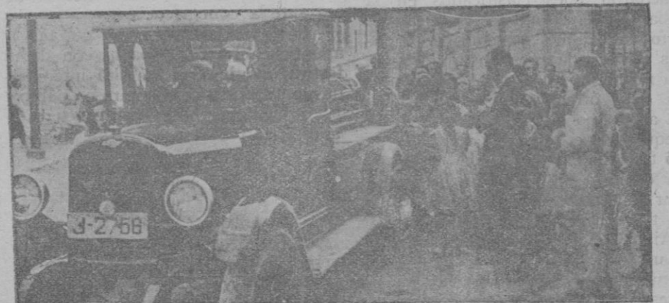
Entierro de los soldados muertos en los últimos sucesos