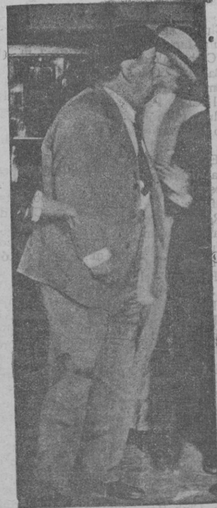
El general Saniurio, al llegar detenido, a Madrid