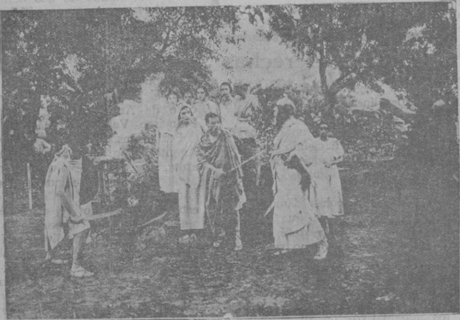
Una escena de la tragedia de Goethe

El público ocupando las gradas del antiguo teatro romano, durante la representación de la tragedia de Goethe, organizada por la Asociación per la Cultura de Mallorca y representada por la compañía «Belluguet» de Barcelona