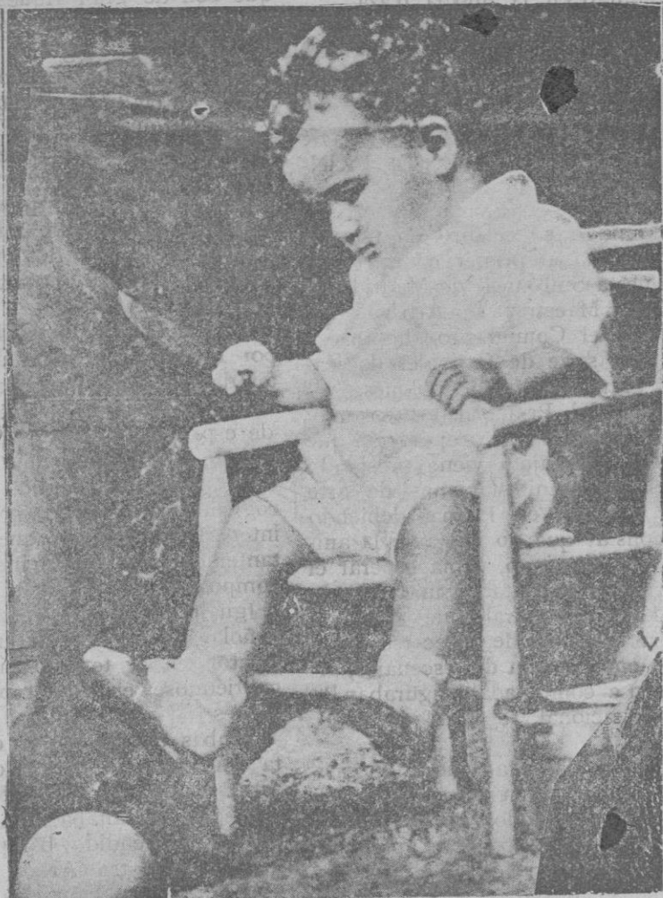
El pequeño Carlos Augusto Lindbergh, cuyo cadáver ha sido hallado, sumiendo en la desesperación a sus padres y en indignación a todas las personas honradas, que anhelan no quede sin castigo el repugnante crimen