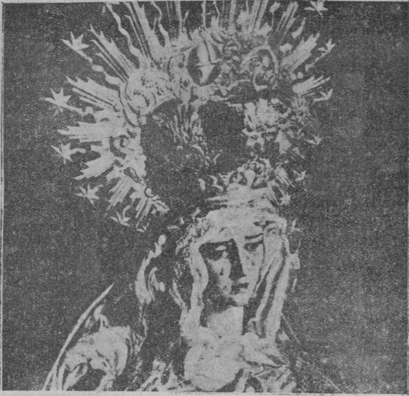
La imagen de Nuestra Señora de la Hiniesta, magnífica escultura de Montañés, objeto de veneración especialísima en Sevilla, que fué pasto de las llamas