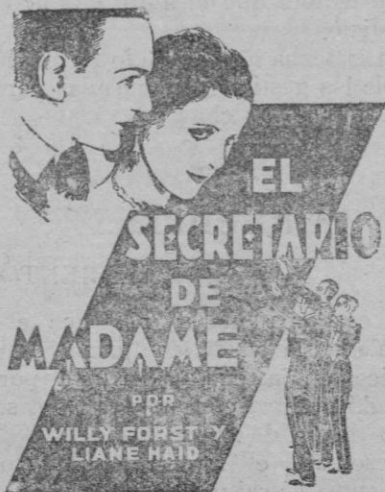
(Das Lied ut aus)