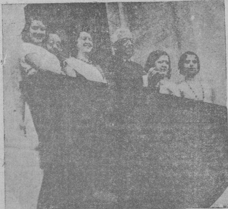
El Sr. Alcalá Zamora, saludando al pueblo mahonés, desde el balcón de la Casa Consistorial, rodeado de bellas señoritas de la localidad

copetes ca'd'es cutí i posades ses pesades botes d'aigo, botes que mos arribaven fins a ne's joncs, sortiem de Sa Roca cap a ne's pont de's gran canal, hont mos esperaven es barquers bufarés que amb ses seves pastetes moravia nde transportar a ne's nostros preparats i distribuïts goitais.