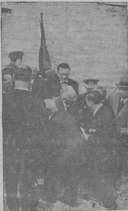
El Sr. Alcalá Zamora al desembarcar, seguido del ex-ministro Sr. Nicolau d'Olwer que fué a recibirles

Se formó la comitiva abriendo la marcha la sección de la Guardia municipal montada, un coche ocupado por la policía, tres ocupados por los periodistas, el Sr. Gobernador civil, la