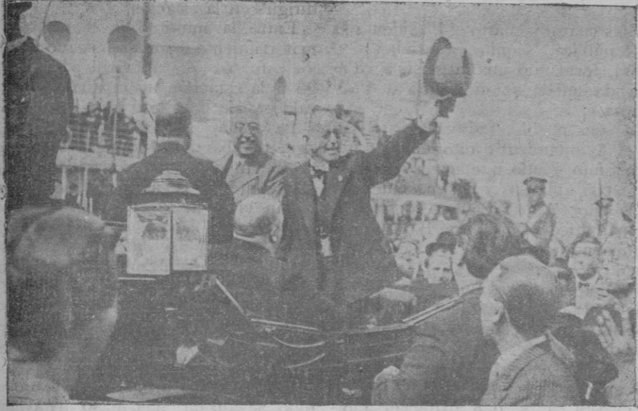
El Sr. Alcalá Zamora junto con el Alcalde de Palma al saludar al público que aplaudía. En el coche van los Sres. Prieto y Giral.