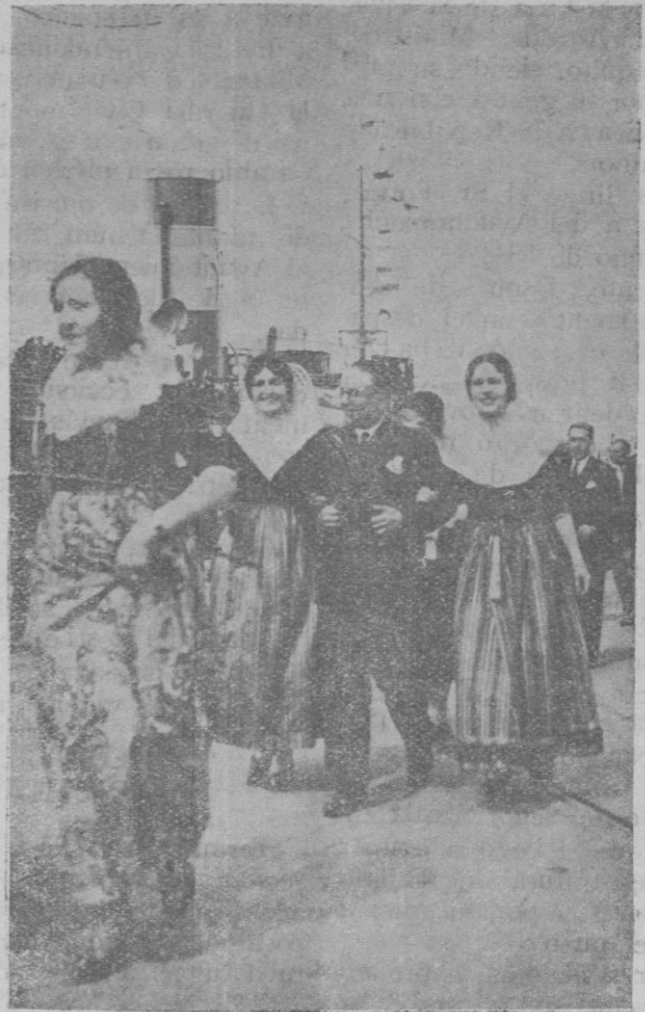
Las señoritas que vistiendo el típico traje de payesa pasaron al puerto a dar la bienvenida al Presidente